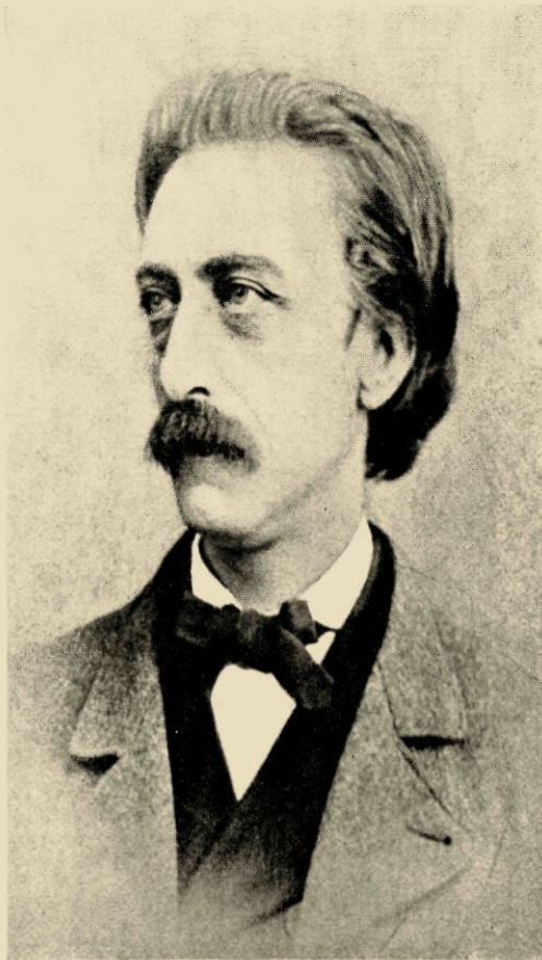
5. Foto Séverin, 1864

De volgende portretten die wij van Multatuli bezitten, zijn de hier als nr 5, 6 en 7 gepubliceerde, die in 1864 gemaakt zijn en waarvan vooral 7 zeer verspreid en bekend werd. Nr 5 is gemaakt door de fotograaf Séverin, waarschijnlijk in Brussel, en vrij onbekend gebleven. Een slechte reproductie ervan staat in Multatuli's Brieven deel V; in het Multatuli-museum staat dit portret echter op zijn schrijftafel, na zijn dood jarenlang de schrijftafel van Mimi, die dit portret daar altijd op had staan. Het is niet slecht, hoewel wat vooropgezet dichterlik. In het z.g. Sjaalman-portret is nog heel wat over van de assistent-resident Douwes Dekker, dat hier geheel schijnt uitgewist.