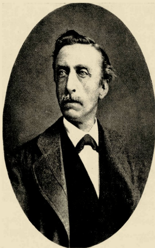
10.

In September 1874 had Vosmaer Multatuli om portretten gevraagd en tot antwoord gekregen: 17 „Wat de portretten aangaat, ge weet niet wat 'n getob dit voor my is. Ik kan niet pozeeren. Als ik er aan denk daartoe uittegaan, beginnen de spiertjes van m'n gezicht al te trillen. Er bestaat een (zeer goed) portret van me. Dat is al 'n jaar of acht oud. Zou dat niet kunnen worden gecopieerd? Dan is 't in eens goed. Ik ben sedert dien tyd afgevallen, o ja. Maar 1 o . Het staat den Havelaar nader. 2 o . Na m'n dood zal 't even goed