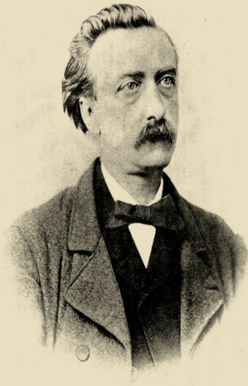
6. Foto Mitkiewicz van eind 1864