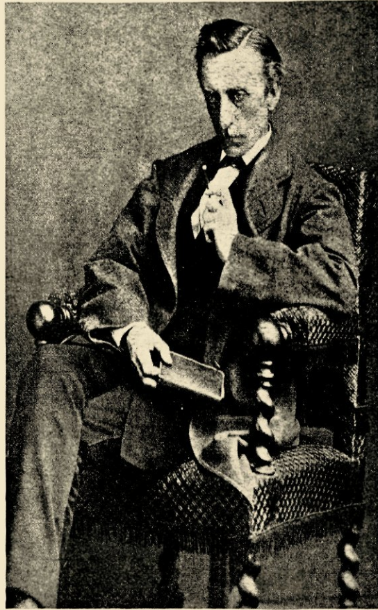
12.