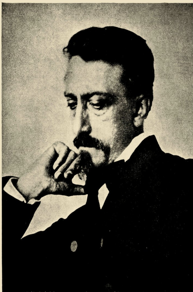
2. Foto naar dezelfde daguerreotype als nr 1

Sindsdien is echter ook het hier als nr 2 gepubliceerde portret verschenen, dat ongeveer hetzelfde is, maar duidelijk een foto, en met scherper details. Dekker lijkt hierop nog minder blond dan op de tekening van Overman; en waar enige haren van de knevel licht opvingen, werd het effect op de foto peper-en-zout-achtig, wat denken doet aan een man die begint te grijzen. Ook de kringen onder de ogen zijn hier dieper; zodat de natekening door Overman het voordeel heeft Dekker èn iets blonder èn iets jonger te maken. Toch moet dit portret nr 2, vermoedelijk een foto naar de gebroken daguerreotype, dichter bij het origineel zijn geweest. Opgemerkt moet worden dat de volgens Mimi mislukte schouder hier wegviel; wat erop wijzen kan dat daar inderdaad een breuk door het glas liep en dat de fotograaf, liever dan die bij te werken, zijn foto daar afsneed. In de bekende literatuurplatenatlas van Poelhekke en De Vooys werd dit portret juist, druk na druk, opgenomen, terwijl het niet de schrijver Multatuli maar de assistent-resi-