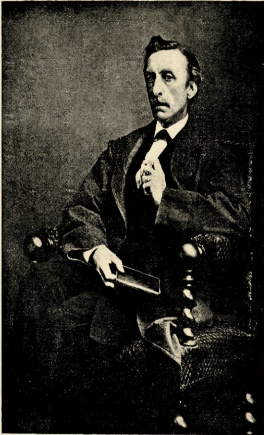
11. 1875