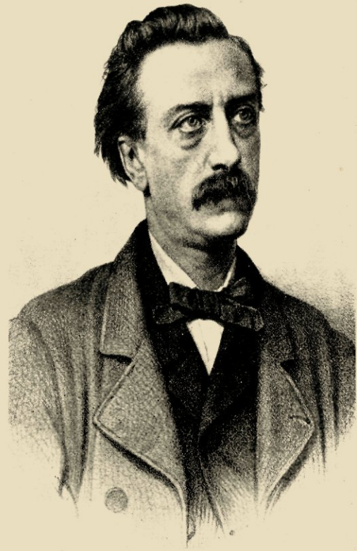
7. Litho Mitkiewicz naar foto 6

(hier nr 7) voor f 10. „Duur? — och, aan niemand kan deze zaak zooveel kosten als ze mij kost”, schreef Multatuli in het prospectus. Misschien moet men daaronder ook verstaan zijn nervositeit en buitengewone tegenzin in het poseren voor de camera; hij vertelt ergens dat hij soms braakte — een van zijn nerveuze uitingen — als hij naar de fotograaf moest.