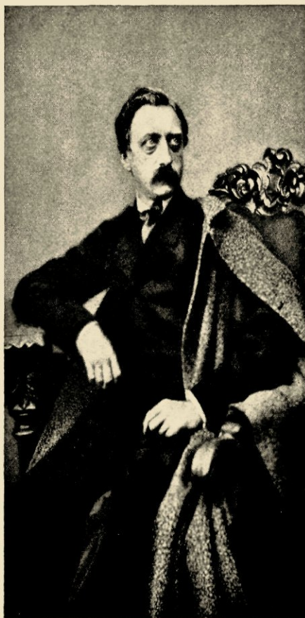
4. 1862