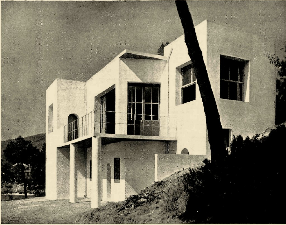
DJO BOURGEOIS, VILLA AAN DE MIDDELLANDSCHE ZEE - LIGGING EN INTERIEUR