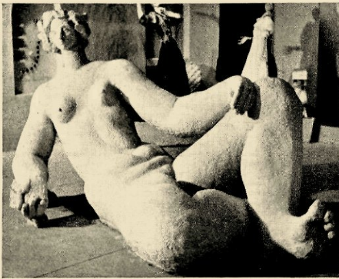
HET PAVILJOEN VAN DE BEVALLIGHEID, WAAR „ALLES INHAM IS EN SLINGERING, EEN UITGEWOGEN SPEL VAN WUFTE BOCHTEN EN UIT HET LOOD GEVALLEN POPPEN,” NAAR DE ONTWERPEN VAN VIBERT, AILLAUD EN KOHLMANN —