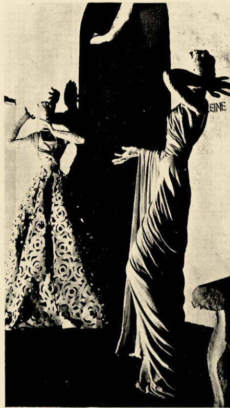
PARIJSCH E TENTOONSTELLING 1937