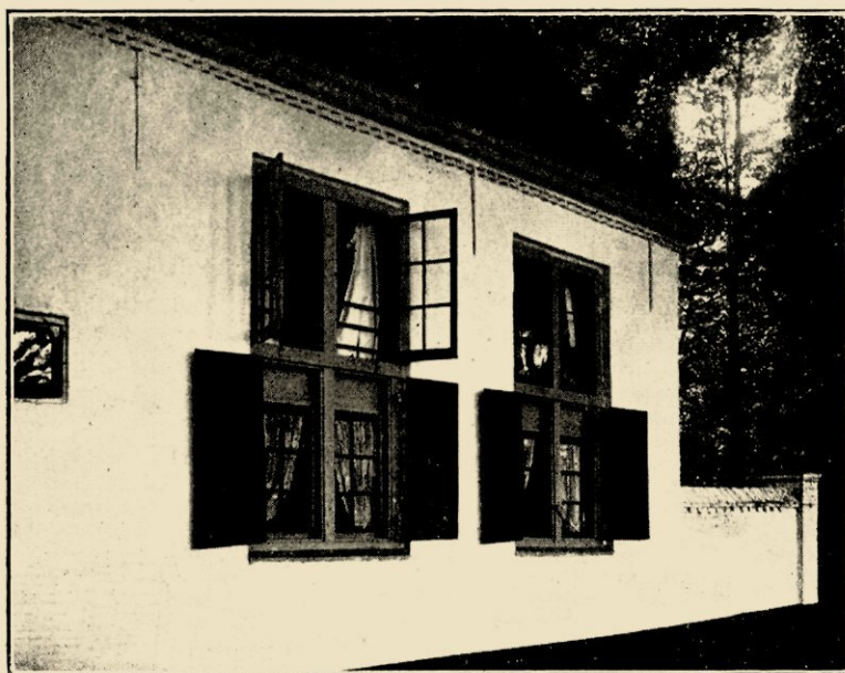
LINKERVLEUGEL, VOORZIJDJE VAN HET GEBOUW.

reeds in 1627, er toe gekomen, zijn wapen te verrijken met den keper en de drie lelies? Het ant- woord moet lui- den: hij heeft het wapen (van) O- verrijn van Scho- terbosch overge- nomen en bij het zijne inge- lijfd! Dit blazoen wordt n.l. door Rietstap beschre- ven aldus: d'ar-