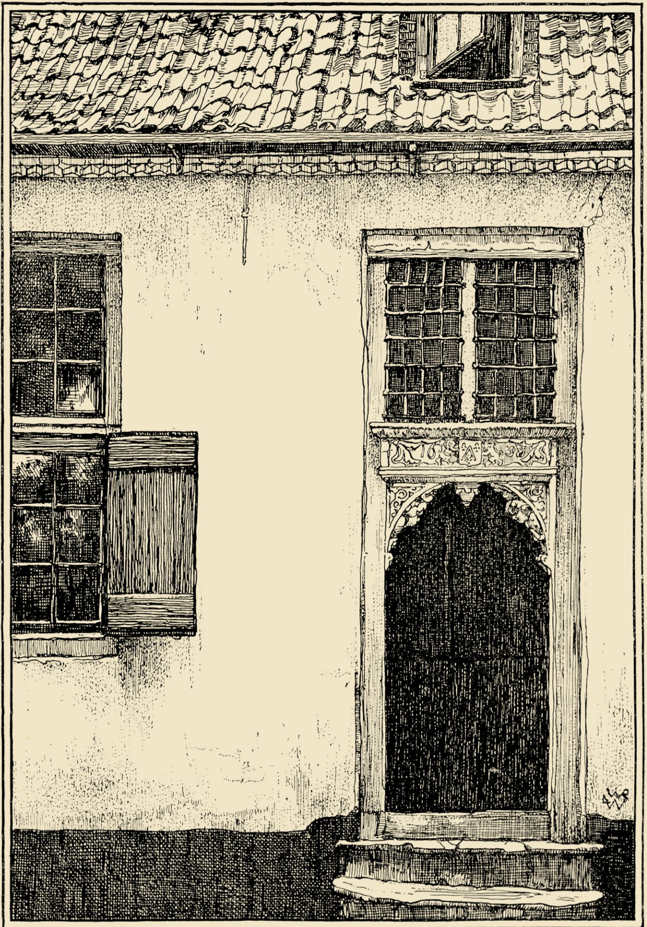
OUD POORTJE TE VELSEREND. NAAR EEN PENTEEKENING VAN L. W. R. WENCKEBACH.