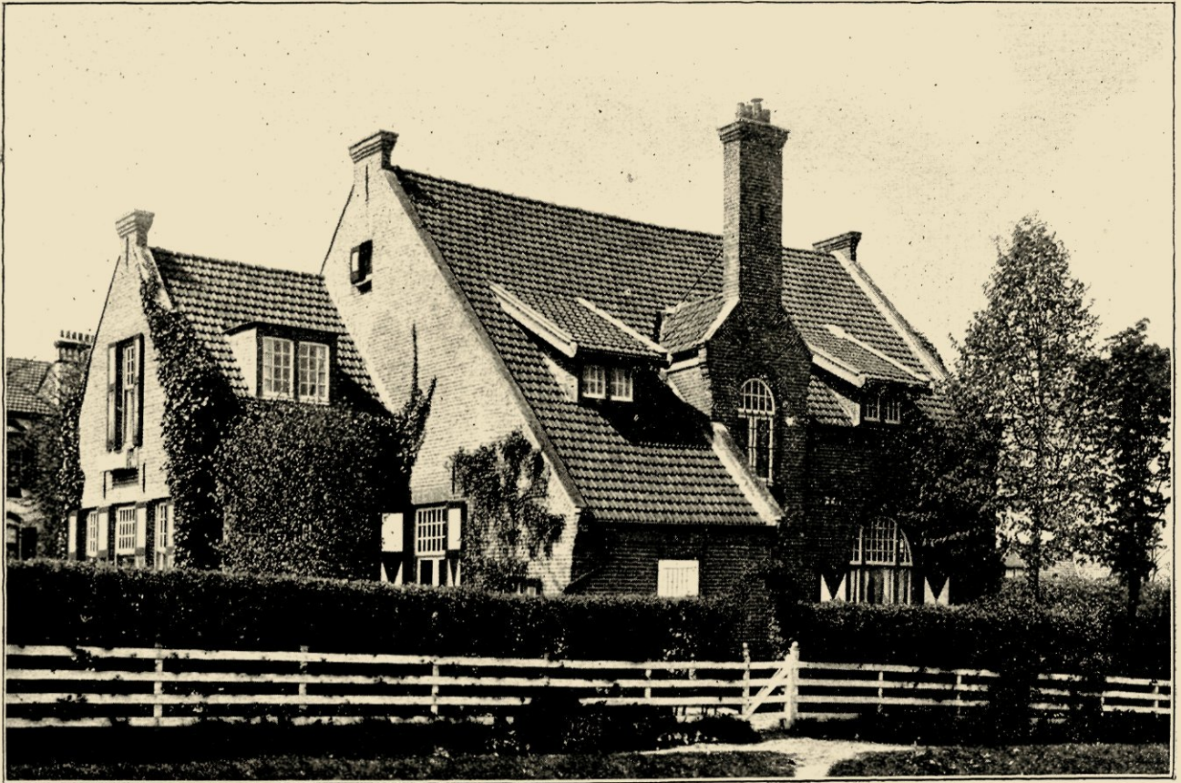
AFB. I. LANDHUIS „DE VELDHOEVE” TE HILVERSUM, GEB. IN 1898, LINKER AANBOUW GEB. IN 1909.

de andere veel voortreffelijks heeft voortgebracht, daardoor zich doende kennen als een onzer beste bouwmeesters, is het van belang hem nader in zijn werk, zijn groei en meesterschap te leeren kennen en daar eenige beschouwingen aan vast te knopen.