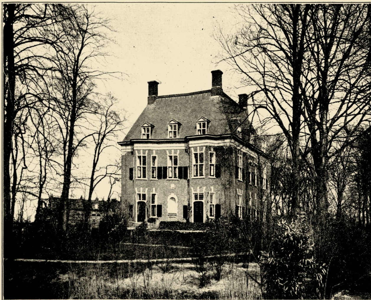
AFB. 5. ACHTERGEVEL VAN „'T HUIS VOORHOUT" TE ALKMAAR, GEB. IN 1906.