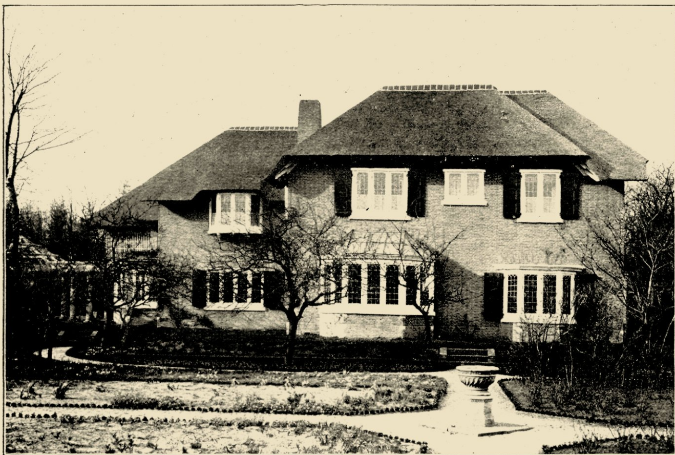
AFB. II. LANDHUIS „DE WILDE ZWANEN” TE LAREN N. H., GEB. IN 1911.

Wat hierna nog van andere, vroegere of latere landhuizen van Hanrath te zeggen, waarom die hier nog te gaan ontleden en bekritisieren? Men oordeele zelf nog naar andere foto's bij dit artikel gereproduceerd, maar hoe men ook getroffen moge worden