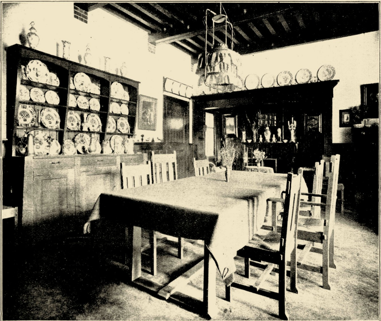
AFB. 3. EETKAMER IN EEN LANDHUIS TE HELMOND, GEB. IN 1901, MET DOOR DEN HEER HANRATH ONTWORPEN MEUBELN.

lig” en „zoo vol variatie” noemen, en daarom van meening zijn dat veel variatie, aardige vondsten, orgineelee ideeën bij den bouw van een villa of landhuis volkomen op hun plaats zijn. De menschen, die zóó spreken en denken, zien de grootheid van de natuur niet, — zij zien de groote harmonie niet, die