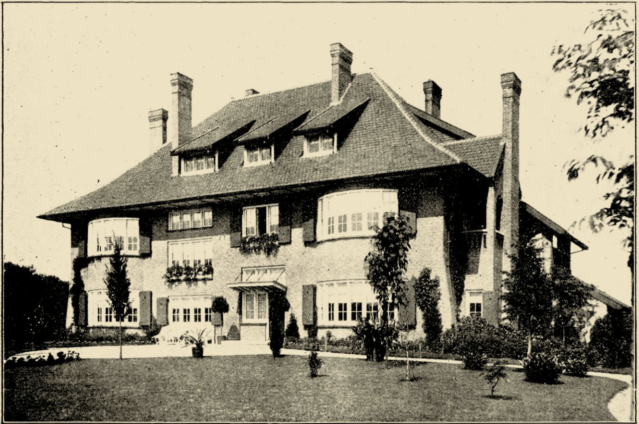
AFB. 2. VOORGEVEL VAN EEN LANDHUIS TE HELMOND, GEB. IN 1901.

Bussum); de dakbedekking van roode, inplaats van donker-verglaasde of gesmoorde pannen oordeelde men zoowaar iets bijzonder gedurfd, hoe belachelijk ons dat oordeel nu ook schijnt.