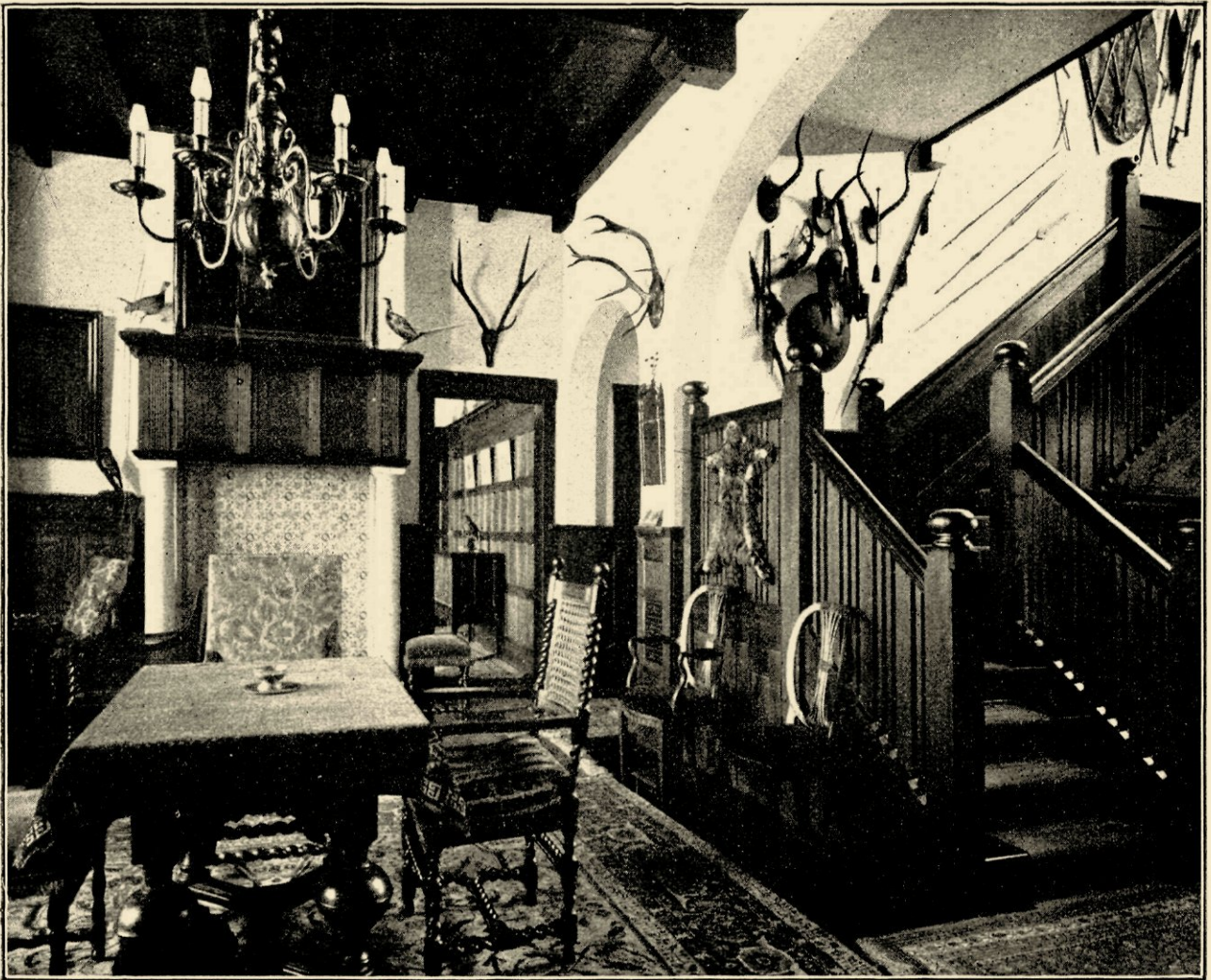
AFB. 10. HAL IN HET JACHTHUIS „OLAERTSDUYN” TE ROCKANJE, GEB. IN 1910.

zware, lange moerbalken, breede trapborden, hooge lambrizeeringen (die de horizontale lijn op- of boven ooghoogte brengen), enz. — Maar wij hadden het voorloopig nog over het exterieur. Wat het schoonheids zoeken in het evenwicht van massa's (raamgroepen, schoorstenen) in den gevel betreft, is Hanrath bij de landhuizen, waarvan de bouw op dien van „D'Olijftak” volgde, nog een stap verder gegaan, n.l. naar het volkomen symmetrisch evenwicht. Dat die stap echter werkelijk een stap vooruit is geweest, moet ik betwijfelen, en Hanrath is dan ook nóg later dikwijls weer teruggekeerd tot het niét strikt-symmetrische (zie den voorgevel van het landhuis „De Wilde Zwanen,” afb. 11). Het kan niet ontkend worden dat de symmetrie een wel wat al te gemakkelijk middel is om harmonie en rust in een gevel te krijgen en de evenwichtigheid, als resultaat van een