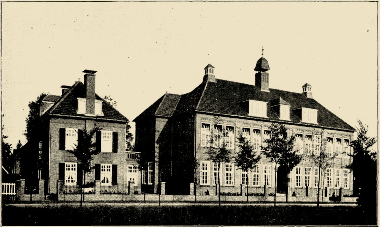
AFB. 4. NUTSSCHOOL TE EINDHOVEN, GEBOUWD IN 1914.

Vervolgen wij nog even de geschiedenis van... zijn landhuisbouw. Want wel heeft Hanrath eenige stadswonhuizen,