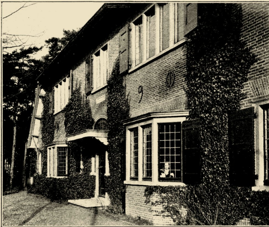
AFB. 7. DETAIL VAN DEN VOORGEVEL VAN HET LANDHUIS „D'OLIJFTAK", GEB. IN 1904.

ook wat het voldoen aan schoonheidsbehoefte betreft, bevredigt (en méér dan dat!). Van dien mensch zou men zelfs mogen verwachten dat hij ook jongeren architecten wien nog geen kans gegeven werd te toonen wat zij kunnen, die gelegenheid zou willen geven.