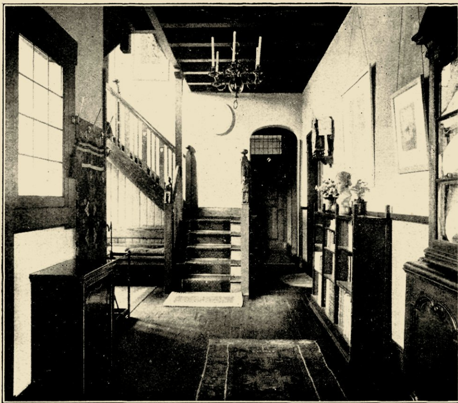
AFB. 8. TRAPHAL IN HET LANDHUIS „DE BIJLAKKER” TE LAREN N. H., GEB. IN 1903. TRAPFIGUURTJES VAN EDUARD JACOBS.

Terugkomende op mijn bewering dat de bouw van „Groenendaal” tweërlei gevolg heeft gehad voor Hanrath, vind ik het verheugenswaard genoemde gevolg nog op nadere aanduiding wachten. Hanrath dan, had door zijn degelijke studie van den Hollandschen Barokstijl zijn gevoel voor zuivere, mooie verhoudingen, en zijn inzicht in de waarde daarvan, zeer versterkt. Bovendien had de opvallende harmonie tusschen onze (en de Amerikaansche) oude buitenhuizen en hun natuur-omgeving hem algemeene conclusies doen trekken omtrent de in het landhuisont-