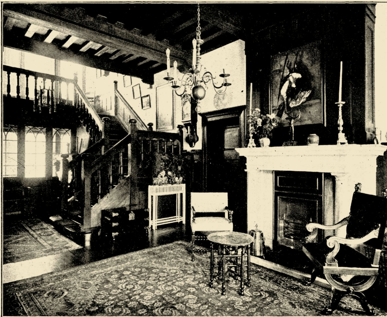
AFB. 9. TRAPHAL IN HET LANDHUIS „GROENENDAAL” TE HILVERSUM, GEB. IN 1905.

mooie baksteenmateriaal en den vorm van het met Hollandsche pannen gedekte, aan beide zijden laag-afhangende dak. Het horizontalisme, de gestrekte en tevens gedrukte vorm, is hier een factor, die het breede, vaste staan, die rust uitdrukt, en waardoor het huis, van verre gezien, bescheidenlijk verscholen gaat in het omringde hout, en als wegduikt onder zijn beschuttend dak.