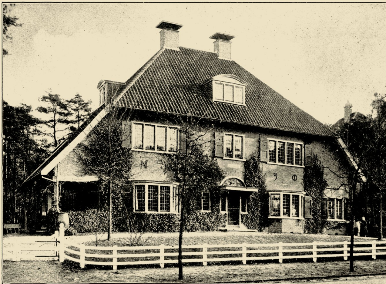
AFB. 6. LANDHUIS „D'OLIJFTAK" TE HILVERSUM, GEB. IN 1904 (WOONHUIS VAN DEN ARCHITECT).

teel, geen raam- of ruitverhouding, die te wenschen overlaat. Dakvorm en -helling, steensoort en -kleur, breedte der voegen, dikte en plaats van raam- en deurstijlen, kleur van het houtwerk, — het is alles juist zooals het zijn moet. Inwendig zijn het de wandbetimmeringen, de schouwen, de balkplafonds, de trapleuningen en -balusters, die met de grootste zorg naar den ouden vorm bewerkt zijn.