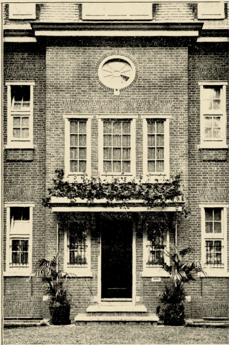
AFB. 13. INGANG VAN HET LANDHUIS „ZOMERWEELE” TE HEERLEN, GEB. IN 1913.