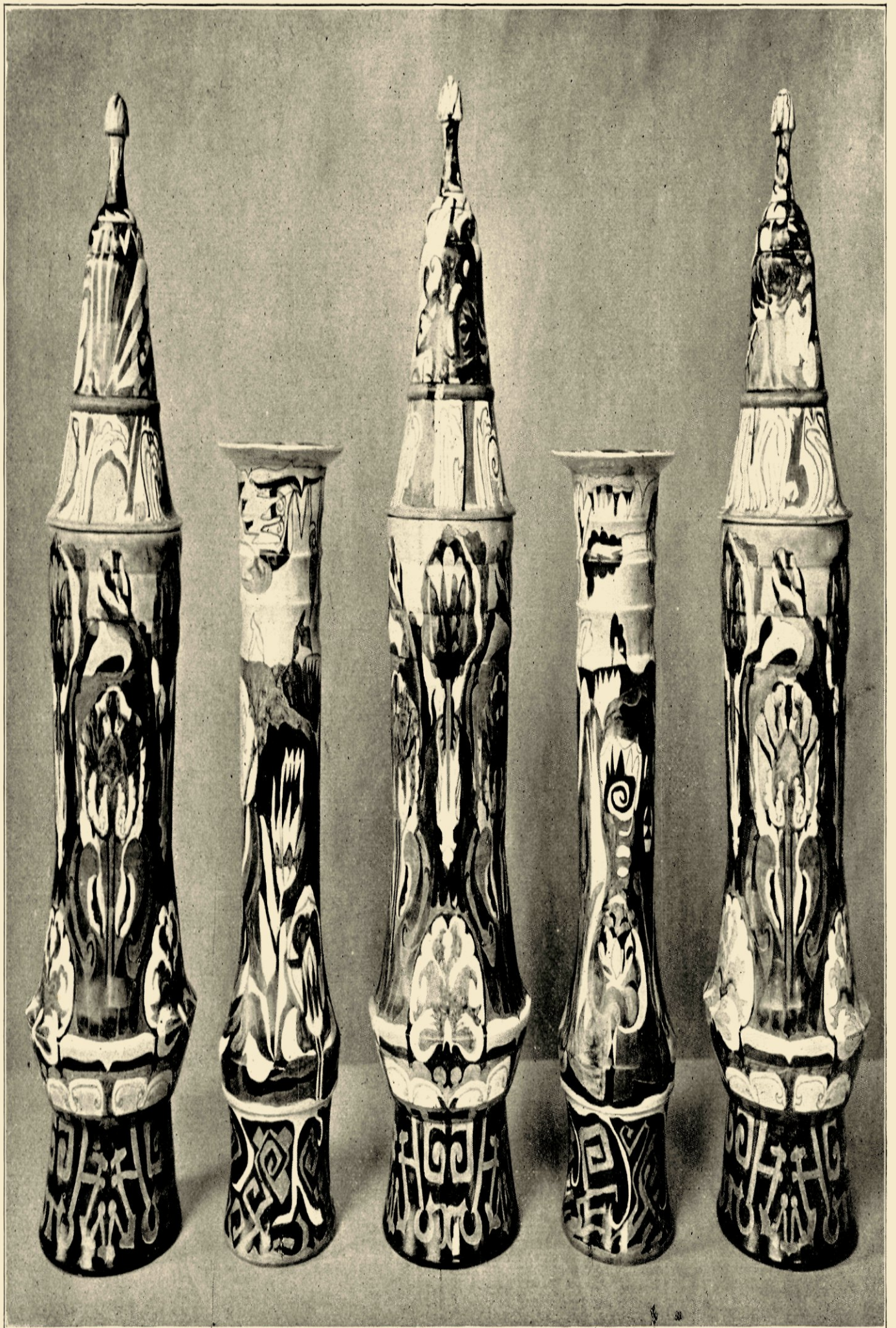
STEL VAZEN EN PULLEN, EIGENDOM VAN MR. H. K. WESTENDORP TE AMSTERDAM.