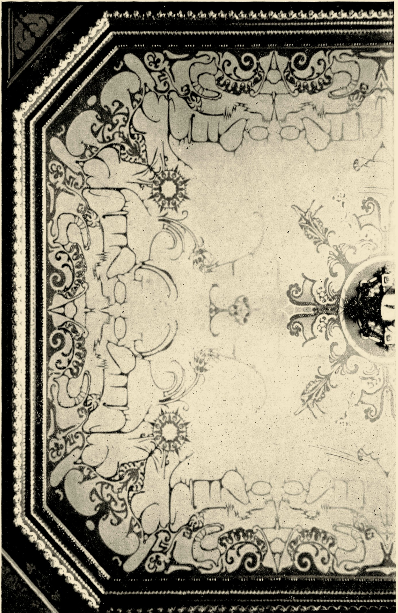
PLAFOND VAN DE BIBLIOTHEEKKAMER UITGEVOERD NAAR ONTWERP VAN TH. A. C. COLENBRANDER.