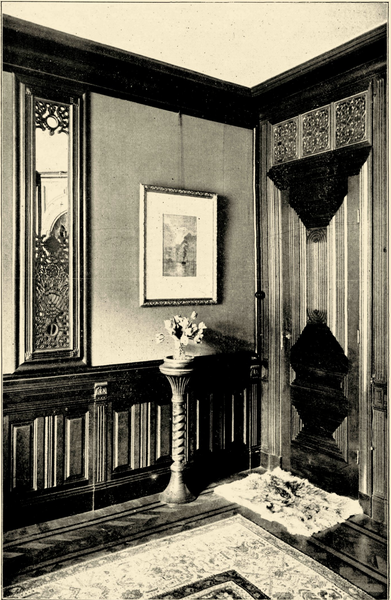
EETKAMER UITGEVOERD NAAR ONTWERP VAN TH. A. C. COLENBRANDER TEN HUIZE VAN MEVROUW DIJK—MESDAG TE 'S GRAVENHAGE.