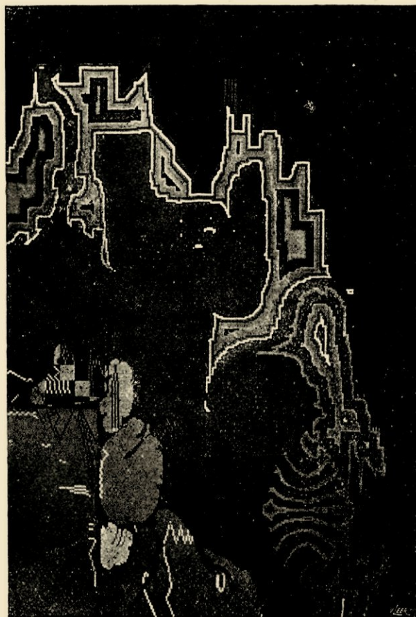
LENTE 21. TAPIJONTWERP VAN TH. A. C. COLENBRANDER.

Kleiner van afmeting is het stel Anjelier; bruin is de hoofdkleur met zwart en grijs versierd; de vorm is rank en wel overdacht; de versiering in strenge kantige lijnen volgt