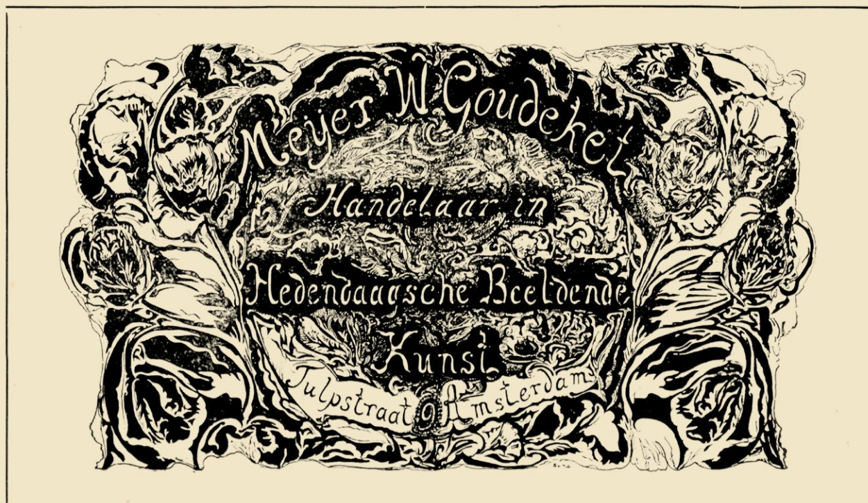
RECLAMEKAARTJE VOOR DEN KUNSTHANDEL VAN M. W. GOUDEKET.

beeld eigenlijk vormt, waardoor het op verrassende wijze karakter krijgt. Ook dit komt voor bij de Perzen, in de weefsels der Kopten en in de wondere schilderingen der Chineezen.