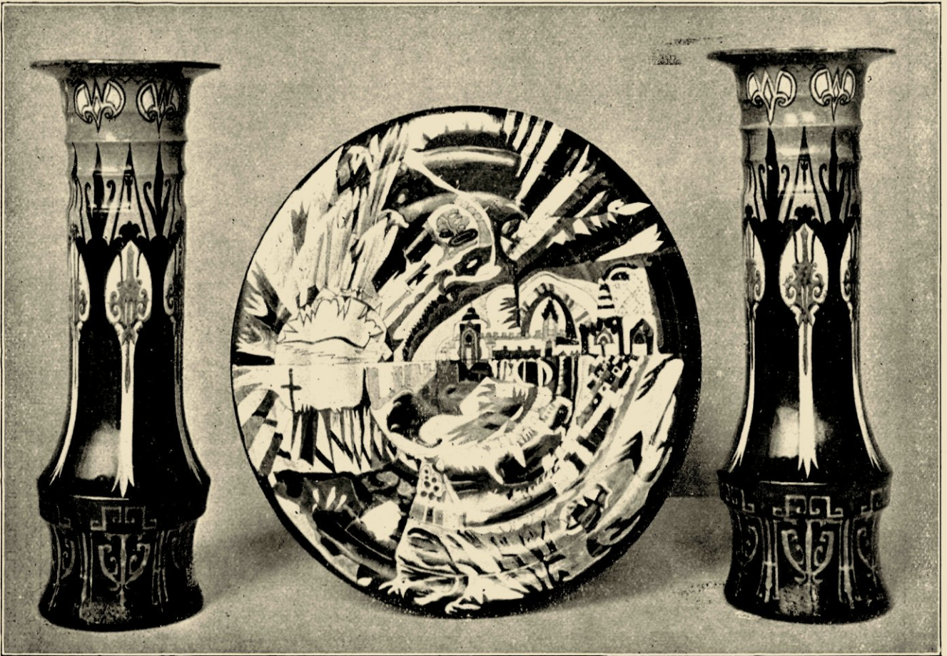
VAZEN UIT HET GEMEENTEMUSEUM TE 'S GRAVENHAGE. BORD „CONSTANTINOPEL”. EIGENDOM VAN DEN HEER J. VAN HOUTEN, AMERIKA.

zelfde vorm beurtelings licht en donker verschijnt. Het is de kristallisatie van het ornament. Het verschijnt als een noodzakelijkheid, er is niets aan toe te voegen of van weg te laten, het is altijd eenvoudig, altijd boeiend en als toevallig ontstaan. Het wordt door zijn stelligheid gemeen goed van dat tijdperk. Het volk dat zijn stijl ontleent aan het andere, neemt het over, gebruikt het zooals het gevonden is en wijzigt het niet.