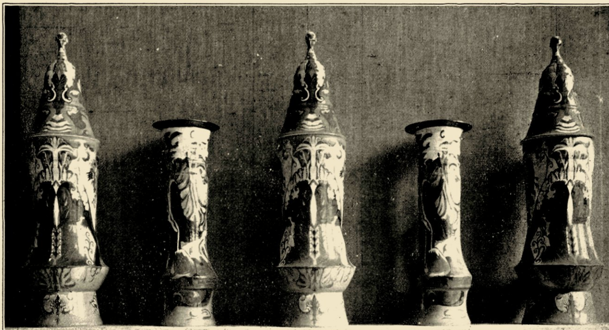
STEL PULLEN EN VAZEN. EIGENDOM VAN DR. C. HOFSTEDE DE GROOT.

ties van Colenbrander. In de versieringen der Maori's en bij alle primitieve volken wordt met blijkbare voorliefde deze wijze van versiering betracht.