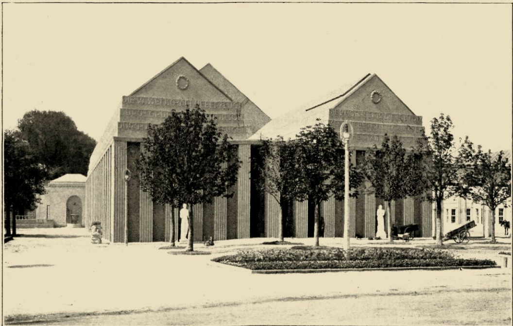
WERKBOND TENTOONSTELLING KEULEN. HET OOSTENRIJSCH HUIS ONTW. DOOR PROF. JOSEF HOFFMANN TE WEENEN.

Ons land is eveneens vertegenwoordigd, tenminste zal vertegenwoordigd zijn. Want