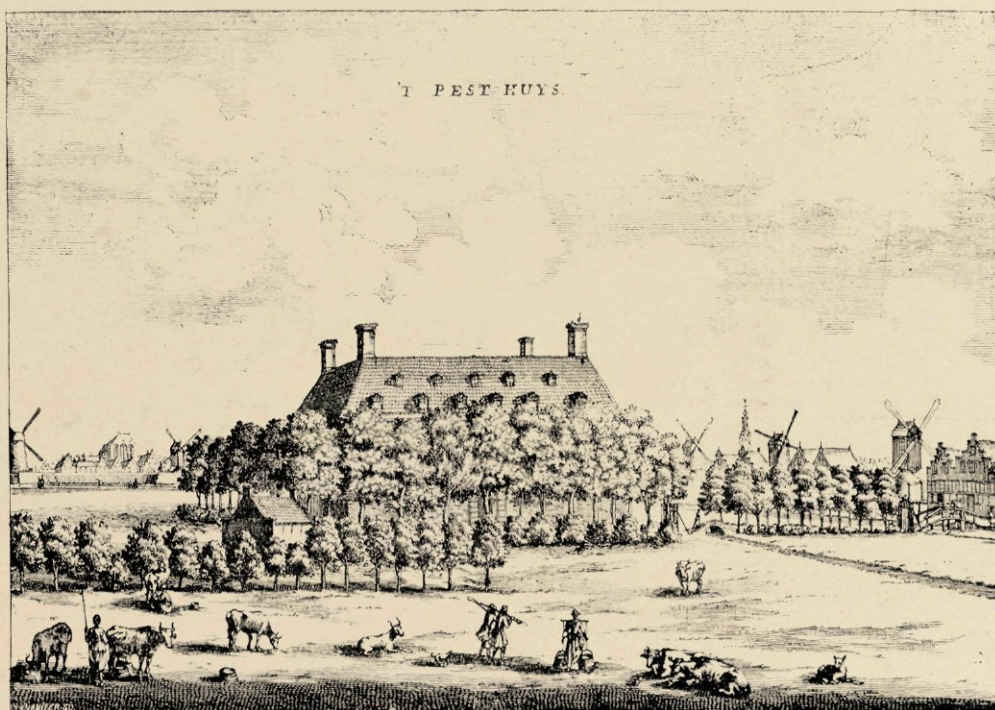
HET PESTHUIS A°. 1630.

Niettegenstaande de brug over den Over- toom (Pestbrug), die naar het oude Buiten- gasthuis leidt, in haar naam nog de herin- nering levend houdt aan de oorspronkelijke bestemming van het sombere gebouw met zijn vervallen aspect, hebben de jaren een zeker geheimzinnig waas om zijn geschiedenis ge- weven. Men weet te vertellen, dat het in vroeger eeuwen monniken tot klooster diende. Ja zelfs heeft de ongebreidelde fantasie er