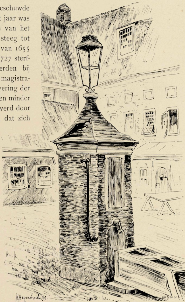
DE BINNENPLAATS MET DE POMP. NAAR EEN TEEKENING VAN H. HEIJENBROCK.

In 1732, 's nachts van 14 op 15 April, brandde het gansche gebouw bij ongeluk van binnen bijna geheel uit, waarna het kort daarop in bijna dezelfde gedaante werd herbouwd. Ter herinnering aan dien herbouw werd boven den schoorsteen in de Regentenkamer een