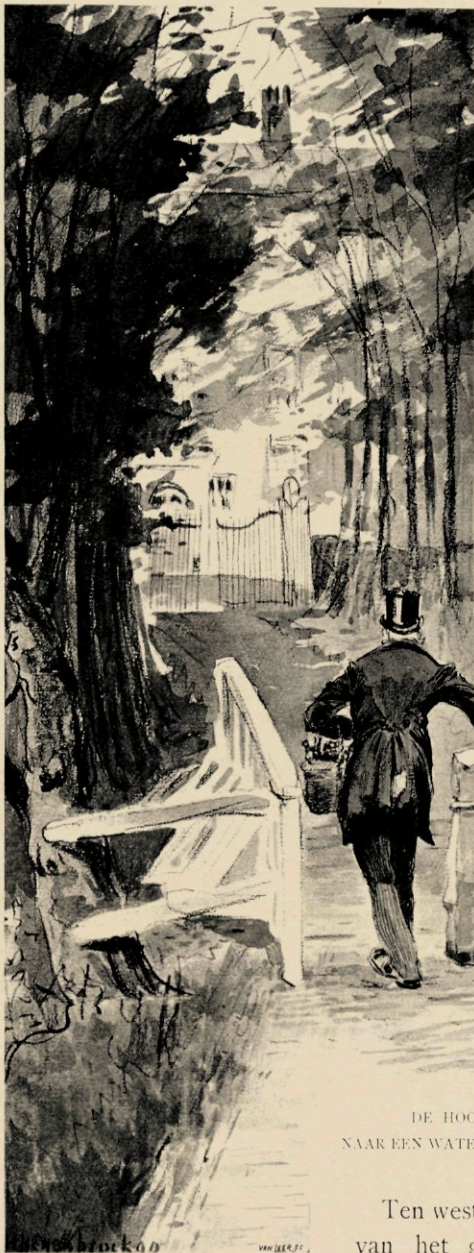
DE HOOFDINGANG TOT HET PESTHUIS. NAAR EEN WATERVERTEKENING VAN H. HEIJENBROCK.

huyskens voor krankzinnigen," terwijl nabij het mannenhuis de apotheek was gevestigd, die „dagelijcx uyhet Gasthuys*) gestoffeert werdt."