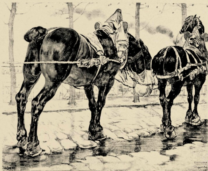
PAARDEN AAN DE SEINE IN PARIJS

naar boven toe, waar zij over het rad van een zware katrol loopt, om dan te dalen naar een stevig bevestigde dommekracht naast den voet.