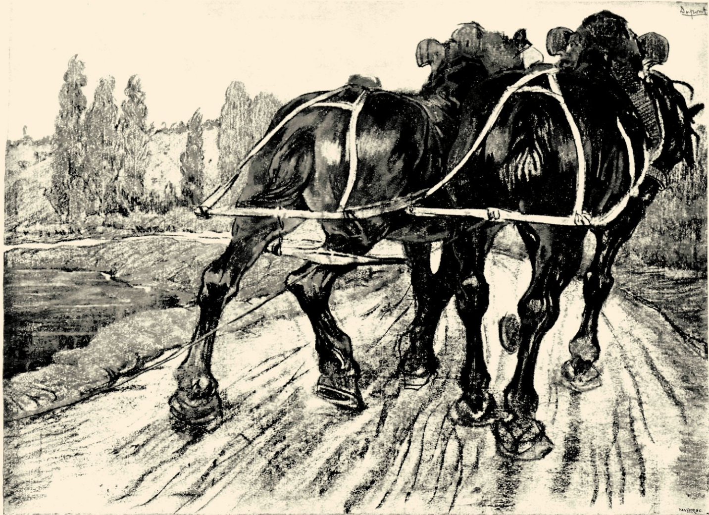
JAAGPAARDEN LANGS DE MARNE NAAR EEN PASTEL