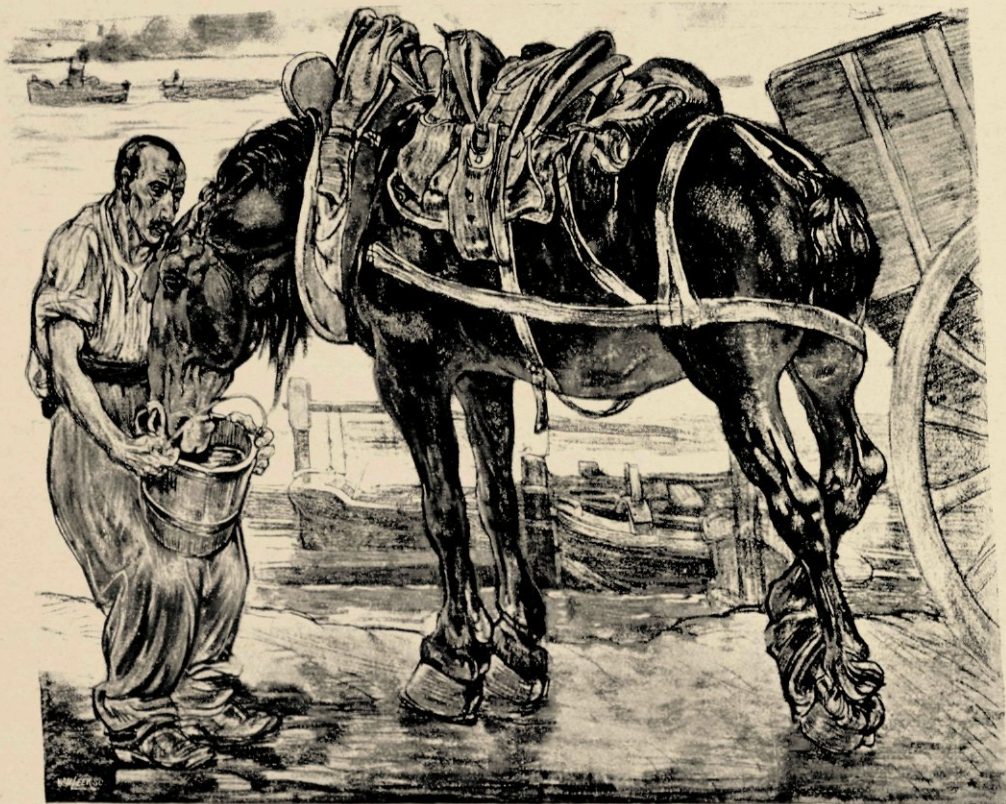
DRINKEND PAARD AAN DE SEINE

Er is een merkbaar verschil tusschen den Dupont van Amsterdam in 1895 en den Parijschen Dupont van heden. Toen was het hem te doen — het is reeds voor deze gezegd zij het al niet met dezelfde woorden, — om het tafereel geheel van een brok stad