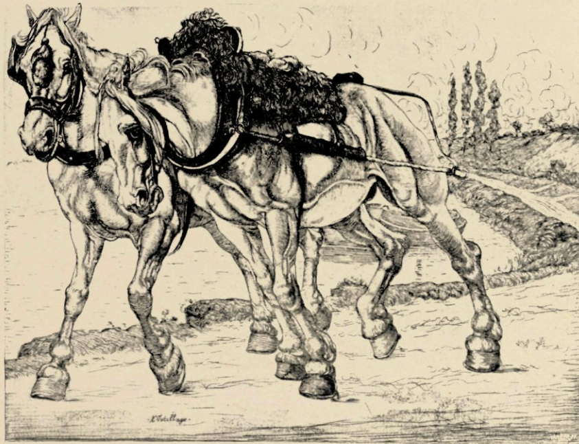
JAAG AARDEN LANGS DE MARNE

Een veertigtal etsen en kleine studies op zinken platen dagteekenen uit die eerste periode, waarvan er acht, de besten, door de firma Van Wisselingh te Amsterdam in den handel zijn gebracht. Hij koos zijn onderwerpen nu eens op de pittoreske oude grachten van Amsterdam, dan weer op de akkers buiten de stad. De grillig hoekige silhouet der huizengevels tegen den helderen hemel trok hem bijzonder aan, en gaarne laat hij dien zien door de bladerlooze takken van een boom. Zoo deed hij met zijn bekende ets van het Oude-Kerkplein. Elders toont hij een gevoelig oog voor de levendigheid op de kaden, zooals in die andere van het Damrak met schuiten op den voorgrond en daarachter de uit het water opruizende huizen. Zijn „Twee