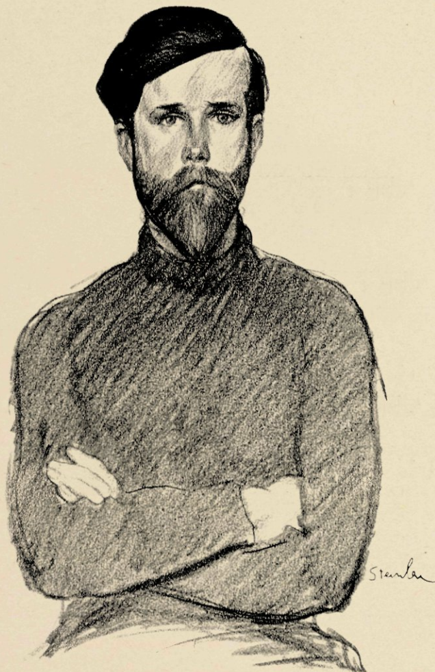
(NAAR EEN ZWARTKRIJTTTEKENING VAN STEINLEN)

tusschen wier beide zijmuren een groote vierkante ruimte gevuld gaat worden met de op elkaar gestapelde zes of zeven verdiepingen, waar menschen-vreugd en menschen-smart naast elkander zullen wonen, zonder van elkander iets te vermoeden; hoog, zoo hoog dat zij schijnt een ladder om den hemel te beklimmen, verheft zich de van lange palen en zware balken opgetrokken stelling,