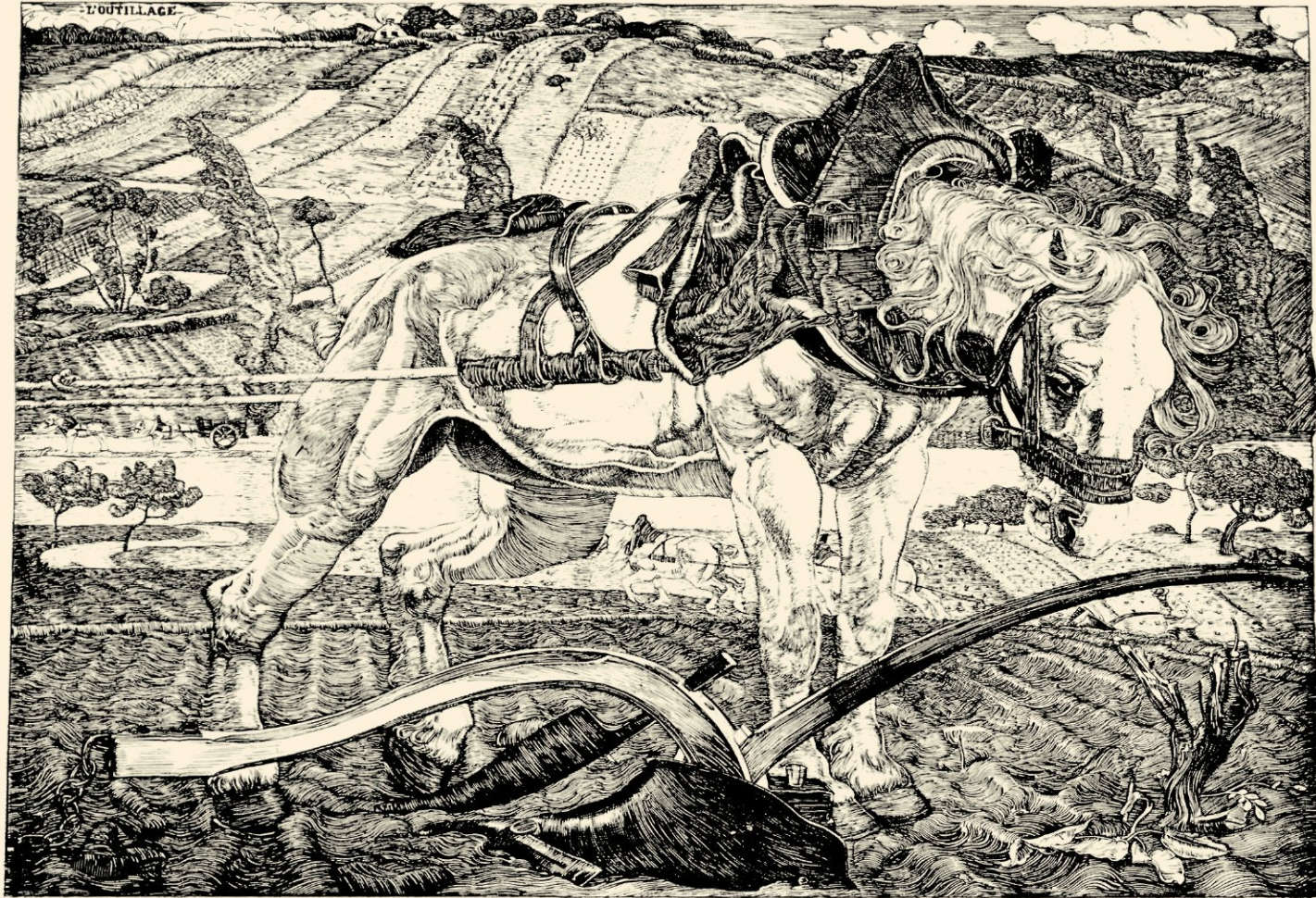
PLOEGEND PAARD BIJ FONTENAY-AUX-ROSES NAAR EEN KOPERGRAVURE