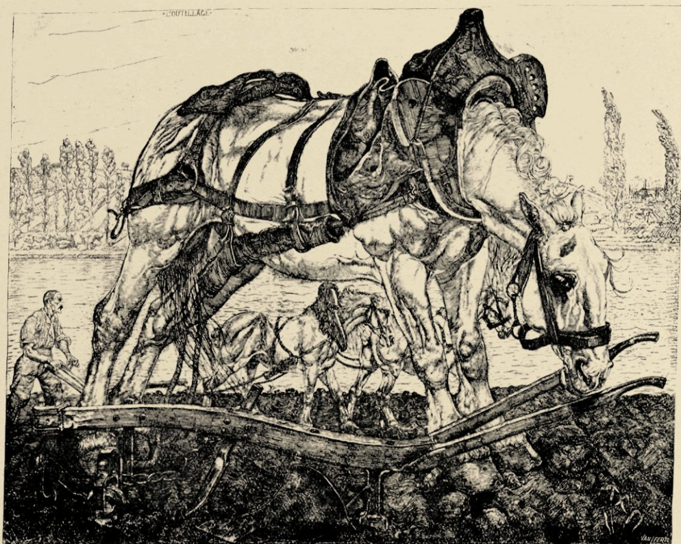
PLOEGPAARD AAN DE SEINE