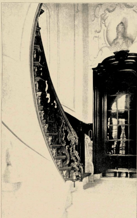
TRAPPENHUIS IN DEN TRANT VAN LODEWIJK XV.

Heerlijk geaderd marmer op den vloer en langs den onderkant der wanden. Aan het einde een marmeren trap van 5 treden met een gebeeldhouwd harpstuk, die naar een