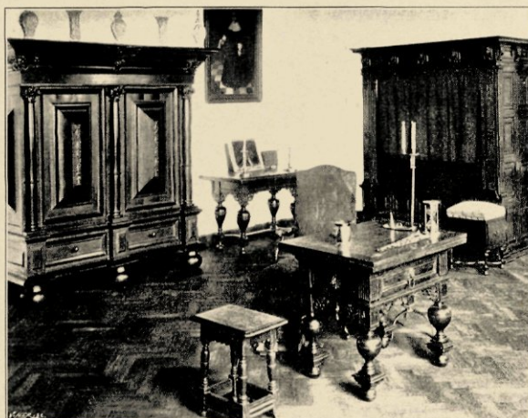
MEUBELS AFKOMSTIG UIT HET BROEKERHUIS.

De zoldering, hier bedoeld, is opgehangen op dezelfde hoogte waarop zij gevonden is, vrij wat lager dan onze tegenwoordige vertrekken zijn. Men bedenke daarbij wel, dat die kamers moeielijk hooger te maken waren, wilden zij ietwat warm gestookt kunnen worden met