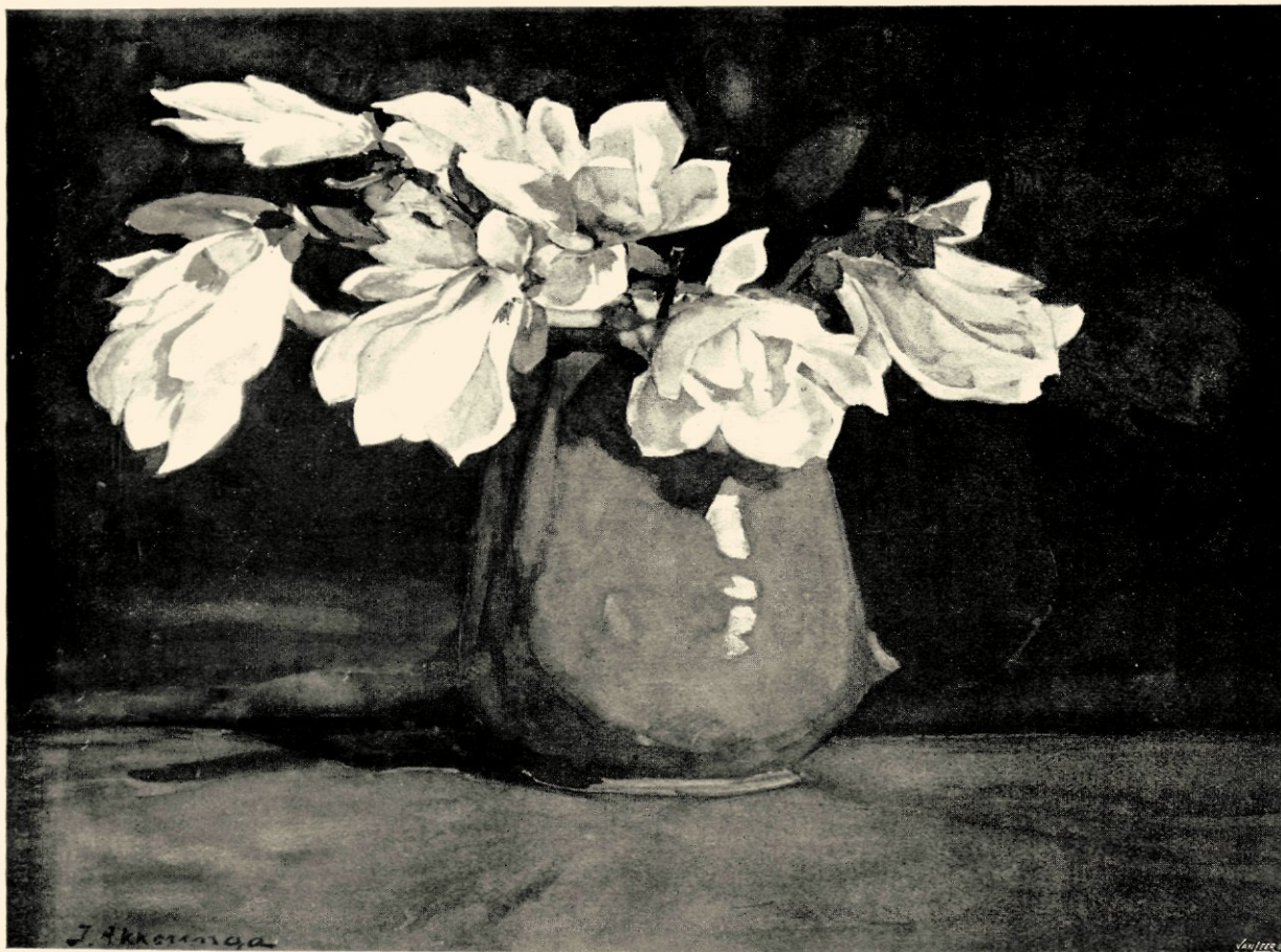
MAGNOLIA'S NAAR EEN AQUAREL.