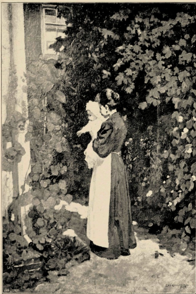
DE OOSTINDISCHE KERS

In zijn nettenboetsters, een onderwerp herhaaldelijk door hem behandeld — wij nemen als type het schilderij in 't bezit van de firma Goupil in den Haag — bewonderen wij de zuiverheid van kleur, een roomen blankheid waarin even een zwakviolette tint oplicht, een breede uitgestrektheid in de warme lucht en daaronder op en langs de duinenreeks boetende vrouwen die als naarstige dieren geduldig en plomp hun eentonige dagtaak afzwoegen. Vooral in deze reeks schilderijen is gemakkelijk waar te nemen dat Akkeringa's kunst zuiver is en harmoniesch. Harmoniesch zoo-