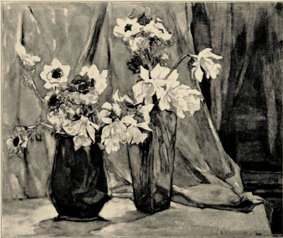
NARCISSEN EN ANEMONEN