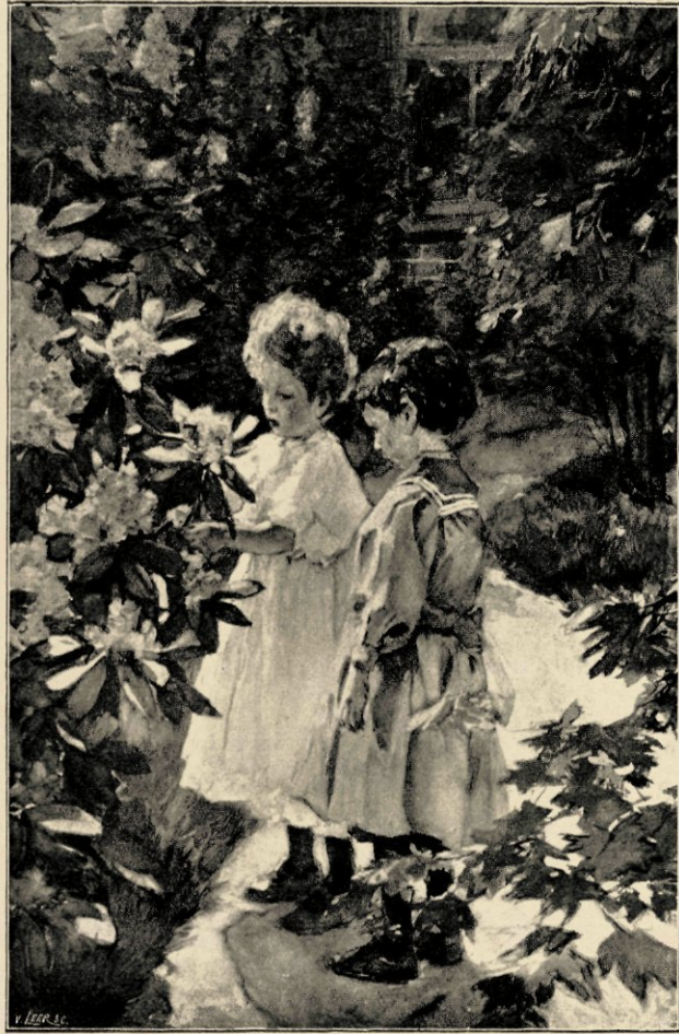
TUINTJE MET KINDEREN

Zoo zien wij ook — wij erkennen het gaarne veel bescheidener, maar toch met een echt gevoel voor stille schoonheid — in een van Akkeringa's tuintjes de boerenbloemen in hun harde stijfheid en schreeuwend kleurenrijkdom ons een ahnung van lichte lentegeuren en luw windelispelen toedemen. In die eigenlijk smakeloze kleurenvolt door grove handen op een waardeloos plekje bij