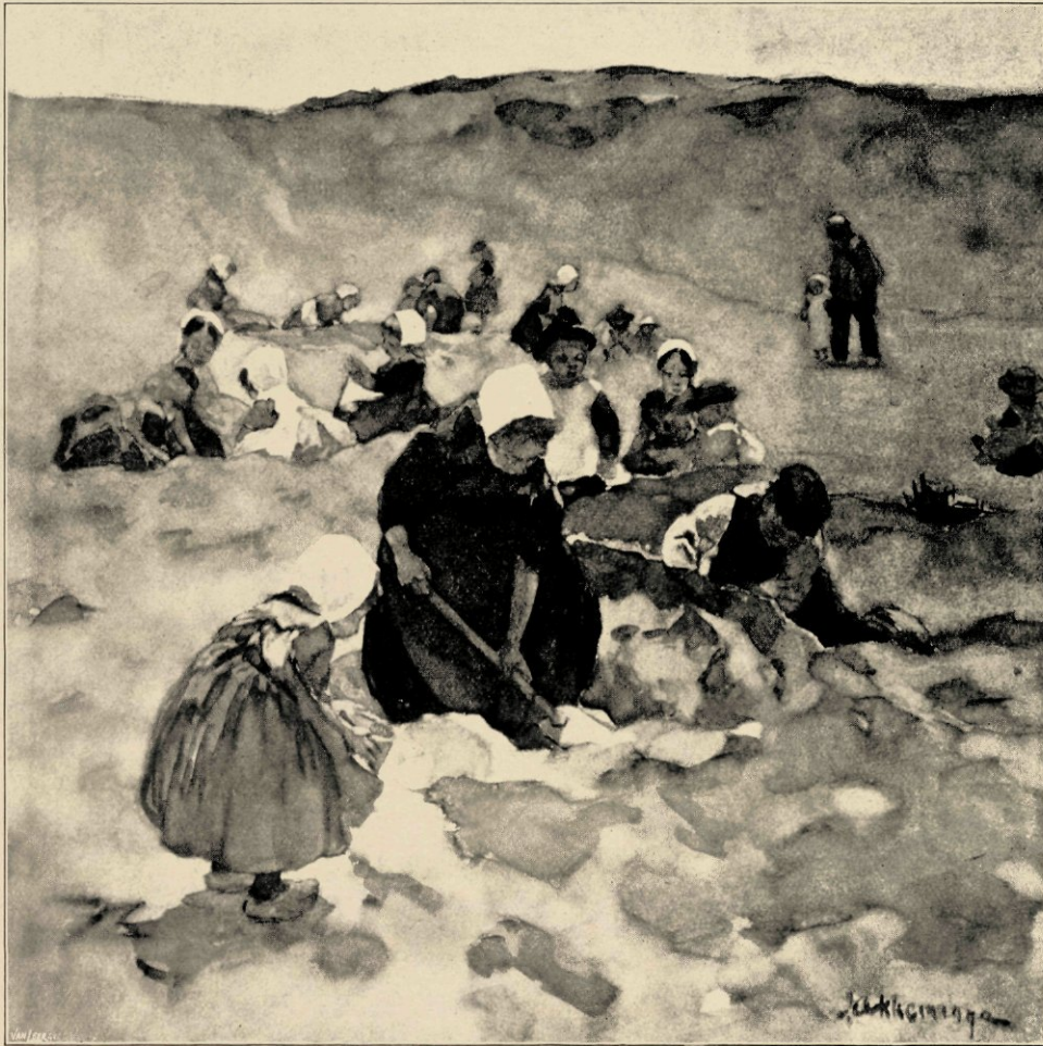
KINDEREN IN HET DUIN

primitieven vergroeid en verstrengeld was met het Katholicisme, toenmaals de drager — en de eenige! — van de hoogste en zuiverste idealen, alleen omdat de krachtigste vroolijkheid en het meest zorgeloze geloof in de blijheid van het leven de eenige rijkdom van Jan Steen en de groote Hollandsche schilders van zijn tijd was, alleen omdat zij met de grootste oprechtheid en de meest