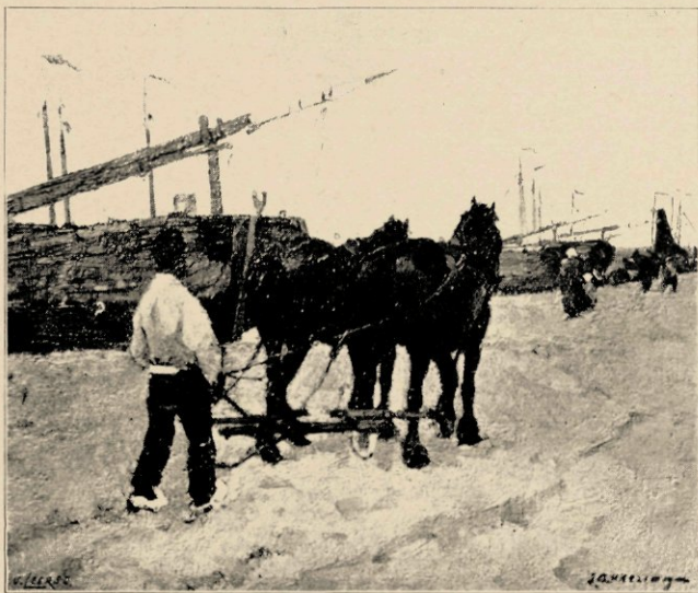
TREKPAARDEN AAN HET STRAND

Ten slotte willen wij nog na- drukkelijk wijzen op een paar schil- derijtjes uit de collectie Titsingh waarvan het onderwerp niet tot het gewone genre van Akkeringa behoort, in de eerste plaats op het zonnige en warme „wedrennen bij Clingendaal” een superbe stukje, prachtig geschilderd, meesterlijk van kleur en compositie en met de grootste zorgvuldigheid en uitvoerigheid behandeld, en op het minitieuze strandgezichtje met zijn intieme schuitjes en de mooie bewegelijke lucht op den achter- grond, beide werken van onmis- kenbare meesterschap.