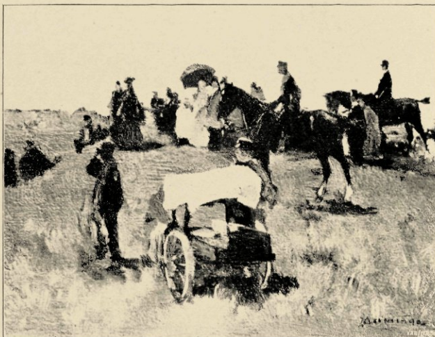
BIJ DE WEDRENNEN TE CLINGENDAAL