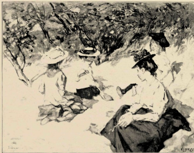
KINDEREN IN HET DUIN

Op deze wijze alleen kunnen wij — indien niet alle dingen slechts eenmaal bloeien — misschien weer veroveren de geweldige levendmakende kracht die er eenmaal uitging van de Hollandsche schilderschool der zeventiende eeuw. Geen zoekers maar ernstige mannen hebben wij noodig die ieder in zijn eigen kunnen, binnen de perken van zijn eigen vermogens gestadig streven die vermogens