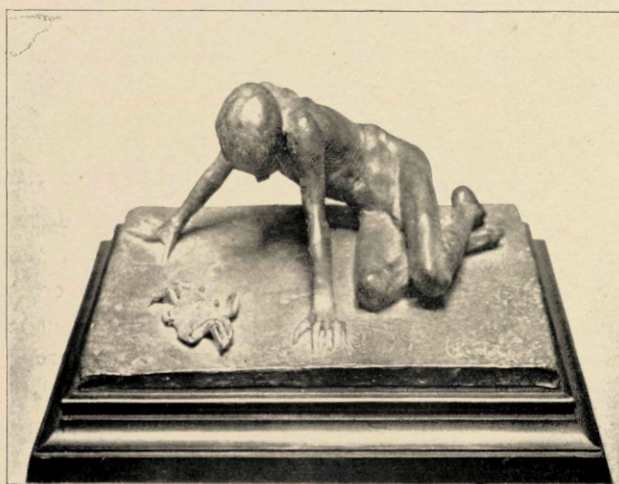
JONGEN SPELEND MET EEN KRABBE