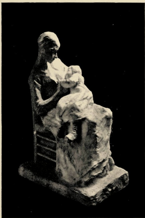
MOEDER EN KIND

zomer plegen te doen, zijn modellen in 't open veld bestudeeren te Nunspeet en te Elspeet. Hij leerde daar het onderscheid kennen tusschen de eenzijdige belichting en de alle karakter doodende pose van het atelier en het karaktervolle leven van menschen en dieren in de volheid van hun bedrijf en te midden van het landschap en de atmosfeer waar zij ongedwongen thuis behooren. Het boetseeren onmiddellijk naar het leven in de natuur bleek al spoedig, na het overwinnen van de eerste technische moeilijkheden, Van Wijk's eigenlijk studieveld. Sedert verschenen van hem een reeks van groepen en enkele beeldjes van arbeiders en vrouwen en kinderen, die nog wat anders uitbeelden dan een in behoorlijke proportiën gemodelleerd menschelijk lichaam. De zware arbeid van die menschen, hun sloven en tobben in den strijd om het bestaan, dat samengegroeid zijn met hun rustieke bedrijvigheid, gaf sentiment en karakter aan zijn werk. Zijn eerste beeldje uit dien tijd, waarvan onder de illustraties een afbeelding voorkomt, het bedremmelde boerenmeisje met den vinger in den mond, was reeds dadelijk een uitnemende proeve