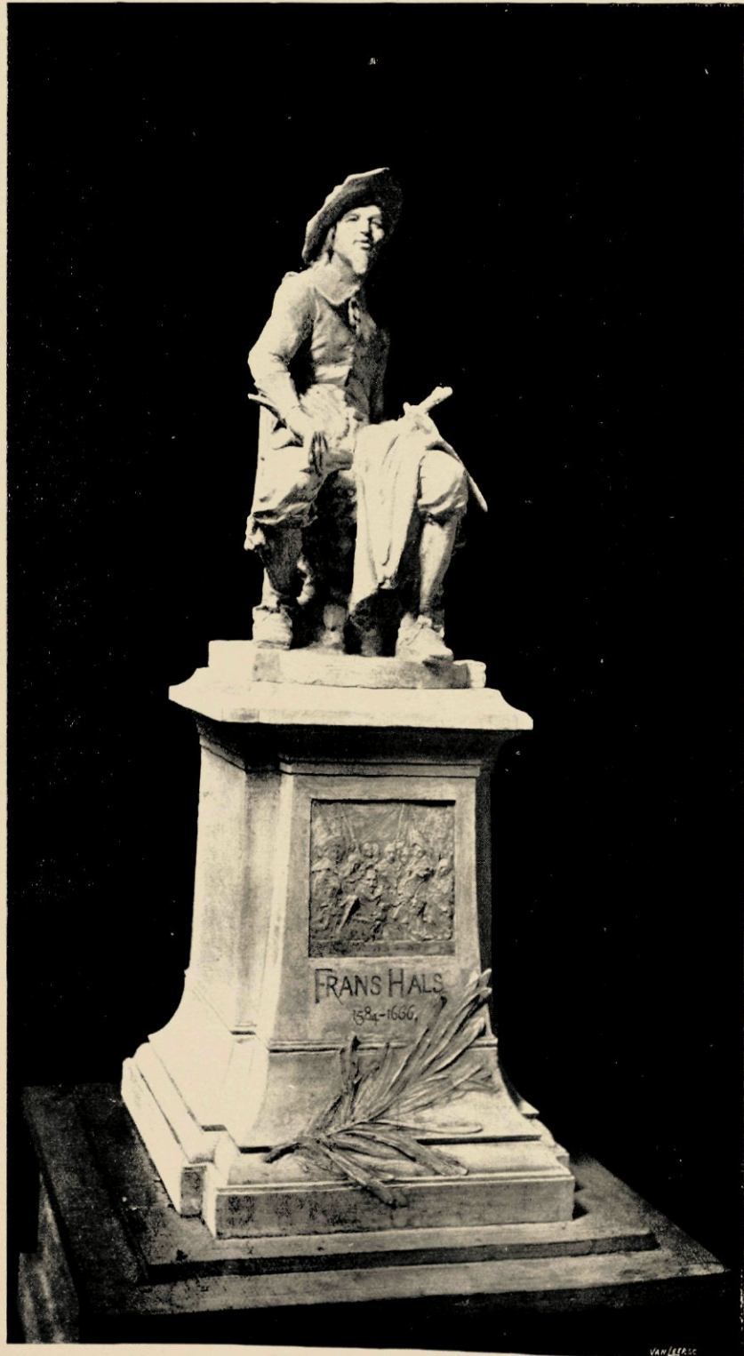
ONTWERP MONUMENT FRANS HALS.