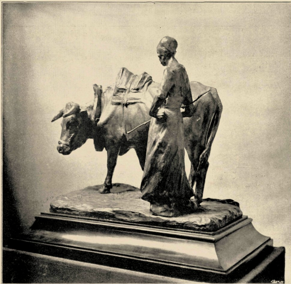
TERUGKEER VAN DEN ARBEID