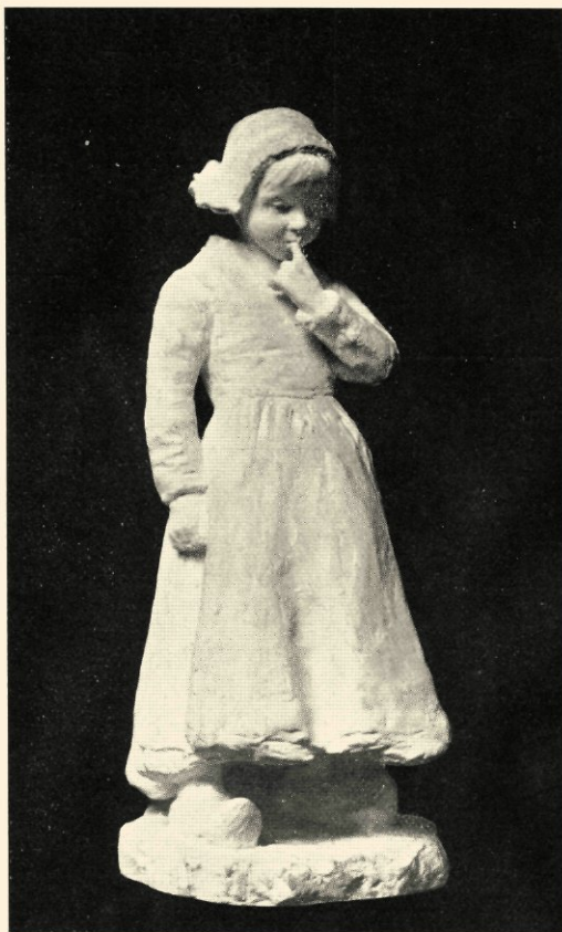
EEN ELSPEETSCH BOERENMEISJE