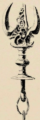
N o . 610. BOVENSTUK VAN EEN TEMPELBEL.

Ook is hier een exemplaar aanwezig van den Singka, Vischnu's leeuw met den zoo imponeerend opgeheven rechterpoot. Zuiver brons, een prachtig stuk van gietkunst en ook, door den ouderdom, van kleur; ongetwijfeld een der oudste voorwerpen der expositie. Vermelden willen wij ook het bronzen Hindu-beeldje (no. 604), wel wat al te zeer overladen met kleederplooien en bloemornamenten maar toch edel van expressie, vooral door het zoo delicaat opgeheven handje waarin de steel van den witten Lotos. Uit Insulinde is het zeker niet afkomstig, maar uit een der landen van Indo-