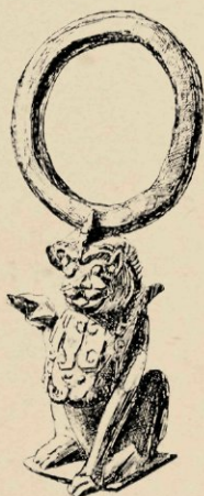
N o . 642. BRONZEN SINGHA. H. 18 CM.

te luiden. Wij noemen hier in de eerste plaats een bronzen bel met op het handvat het rad der wet, een der zeven juweelen van Buddha door welk symbool de symmetrie en de compleetheit van de wet wordt aangeduid, ook gesymboliseerd in de houding der handen van