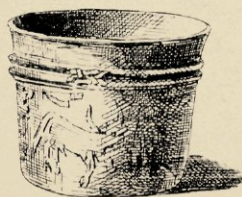
N o . 622. ZODIAKBEKER. H. 9 CM.

lotosversiering; de Vadschra, zooals het behoort te zijn, precies de helft van het geheele handvat. Curieus is ook het handvat van no. 610 — de bel behoort er zeker niet bij! — om de bliksem-vlammen, die zelden bij de Vadschra worden afgebeeld, terwijl wij daarentegen in de handen der oudste Buddha-beelden de enkele Vadschra of zelfs de bellen met Vadschra-steel terugvinden, vooral bij de beelden die in Noord-Indie, Kaschmir en Nepal voorkomen, vereerd als ze werden door een geheele secte volgelingen van den donderstem — Vajra-carya. — Opmer-