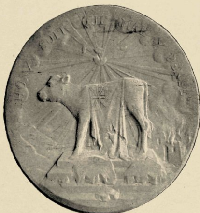
NIET-UITGEVOERD ONTWERP VOOR DE BOEREN-MEDAILLE.

Van Amsterdam ging hij naar Antwerpen, aan welks akademie, ondanks de ongunstige voorwaarden, waarin de ateliers en het onderwijs verkeerden, door gebrekkig licht, onvoldoende plaats en slechte tijdver-