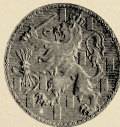
KEERZIJDE VAN DE NIEUWE CENT.