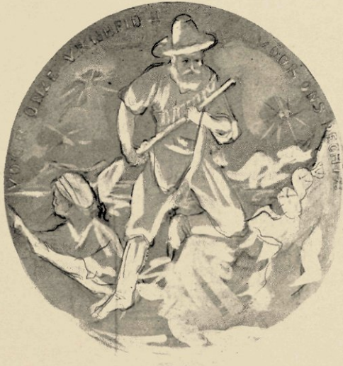
NIET-UITGEVOERD ONTWERP (SCHETS) VOOR DE BOEREN-MEDAILLE.

Wienecke zich met den tweeden moest tevreden stellen, wijdde hij zich, omdat hij gedwongen was groote kosten te ontzien, aan het maken van kleine werken, die tevens gemakkelijker verkoopbaar zijn.