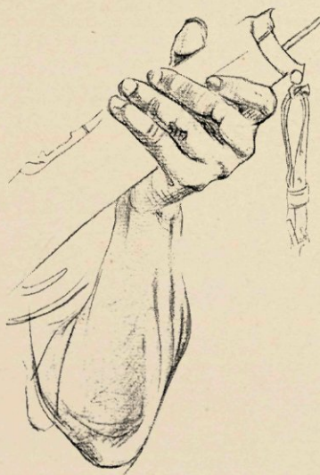
DETAILTEKENING VOOR DE BOEREN-MEDAILLE.

In het verso heeft de artist op werkelijk schoone wijze weer gebruik gemaakt van den Leeuw, de Nieuwe Kerk en de stralenbundels, in een meer aan den ronden vorm der medaille geëigende samenstelling, en vooral met een merkwaardig perspectief.