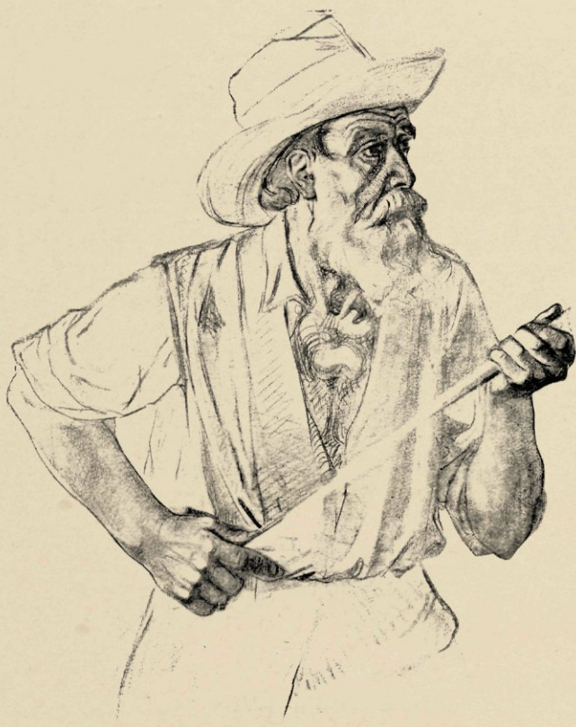
DETAILTEKENING VOOR DE BOEREN-MEDAILLE.

kracht, gewillig, maar tuk op zijn rechten, en met zijn manen dekkend de symbolen van zijn eigen krachtig leven: Nijverheid, Landbouw en Handel. De compositie van deze plaat is bevallig en komt het kunstwerk ten goede, dat zich in conceptie en uitvoering geheel vrij toont van traditie en routine, en dat onmiddellijk bewijst dat Wienecke de kwaliteit van modelleur met die van medailleur weet te paren.