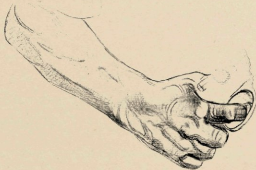
DETAILTEKENING VOOR DE BOEREN-MEDAILLE.

kracht, gewillig, maar tuk op zijn rechten, en met zijn manen dekkend de symbolen van zijn eigen krachtig leven: Nijverheid, Landbouw en Handel. De compositie van deze plaat is bevallig en komt het kunstwerk ten goede, dat zich in conceptie en uitvoering geheel vrij toont van traditie en routine, en dat onmiddellijk bewijst dat Wienecke de kwaliteit van modelleur met die van medailleur weet te paren.