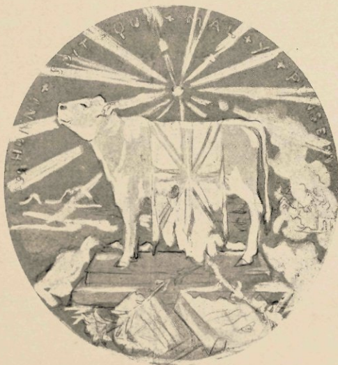
NIET-UITGEVOERD ONTWERP (SCHETS) VOOR DE BOEREN-MEDAILLE.

De verkleining van deze medaille is op onberispelijke wijze uitgevoerd in het atelier