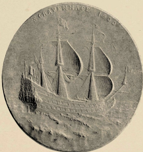
KEERZIJDE DER MEDAILLE VOOR DE TENTOONSTELLING VAN HET ZEEWEZEN.