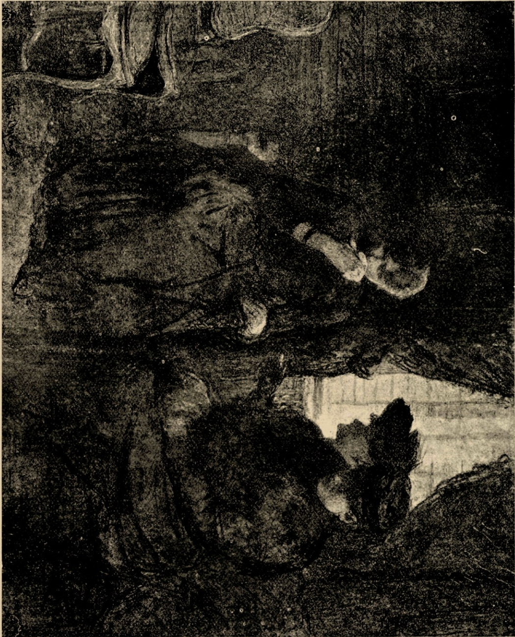
Rouwbeklag, houtskoolteekening van Pieter Oijens.

van paneelen, ramen, lijsten, ezels en ander schildermateriaal; al de overige ruimte is ingericht tot tal van ateliers, die aan mannelijke en vrouwelijke, bekende en adspirant-kunstenaars verhuurd zijn.