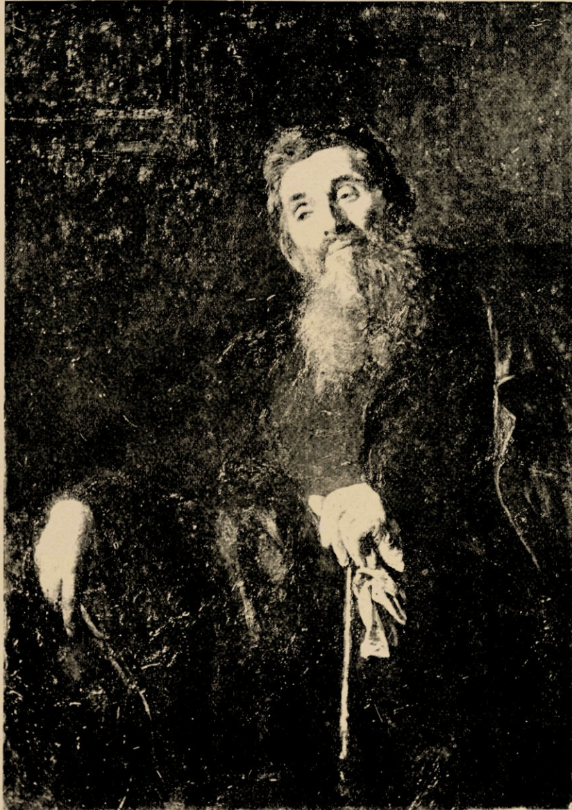
De rust, door Pieter Oijens.

scheidenheid vertegenwoordigd; van nature reeds gracieus in de meeste harer bewegingen en houdingen, komen zij den schilder meestal bij de conceptie van zijn onderwerp halfweg te gemoet. Aldus geholpen, moest het aan Pieter niet moeilijk vallen op zijn rijk palet de heerlijke toetsen te vinden, waarmee hij den lof verkondigde der knappe, kraakzindelijke Amsterdamsche