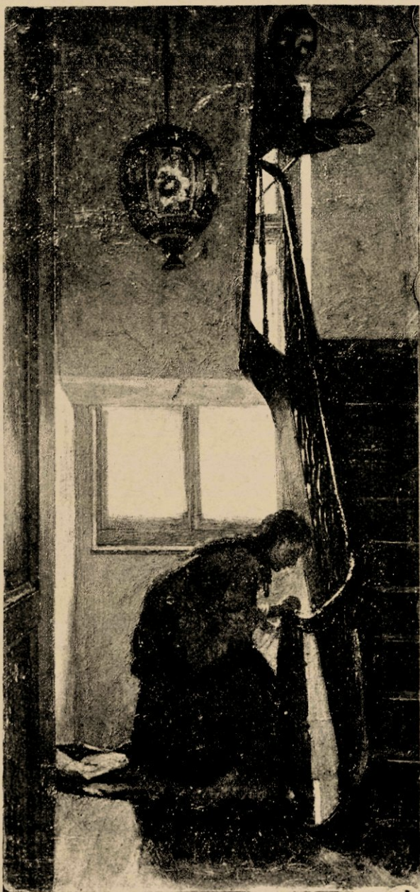
De kommensalen, door Pieter Oijens.

steeds tezamen werkend, nooit samen aan één doek arbeiden: geen penseel-trek van den éénen komt er op het werk van den anderen. Bestaat er in den trant der gebroeders, evenals in hunne gelaatstrekken en gestalten, eene bij den eersten aanblik treffende gelijkens, — bij nader en langer toezien komt het verschil meer en meer op den voorgrond, en ontdekt men weldra welke