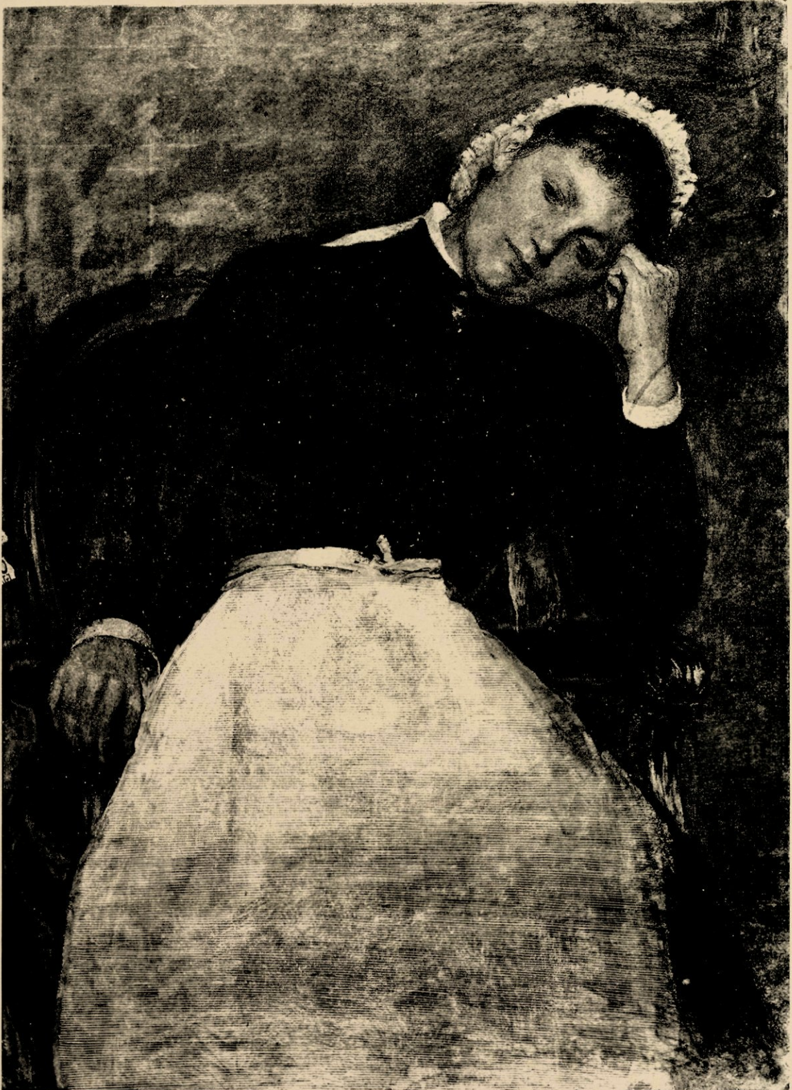
Het kamermeisje, krijttekening van Pieter Oijens.