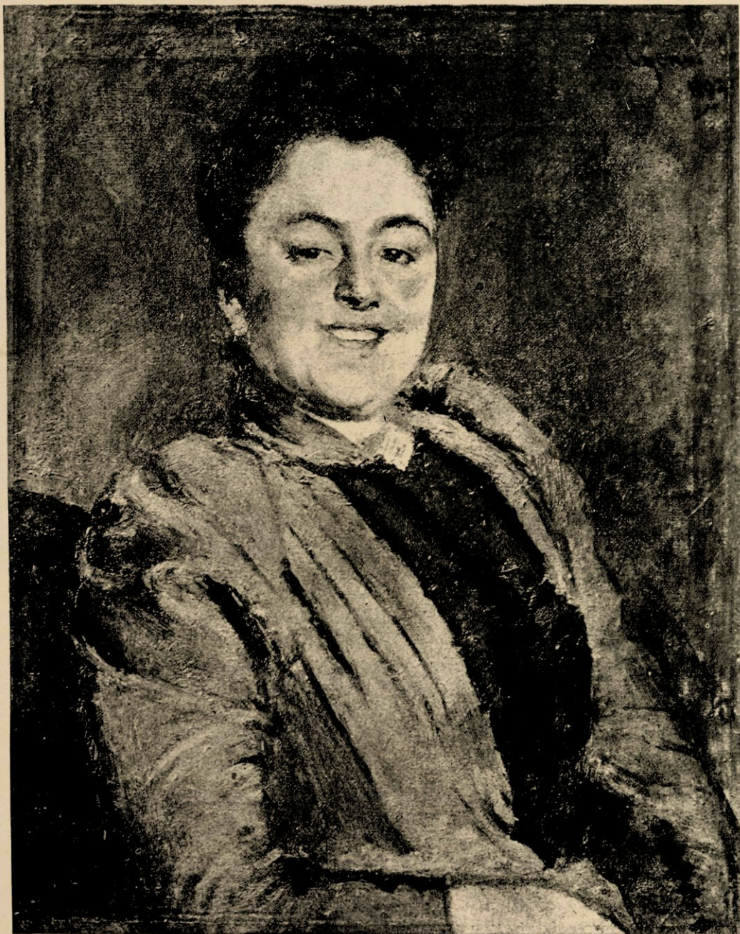
Portret van Mej. B. ... door Pieter Oijens.

Navez, had Portaels, in 1860, zijn atelier opengesteld voor een twintigtal jongelingen, wier aangeboren goede eigenschappen hij — en zulks minder door theoretische stellingen dan wel door practische wenken en een onophoudend verwijzen naar de levende natuur — tot hunne algeheele ontwikkeling wist op te kweken, in dier mate dat de jonge kunstenaars, lang reeds voor