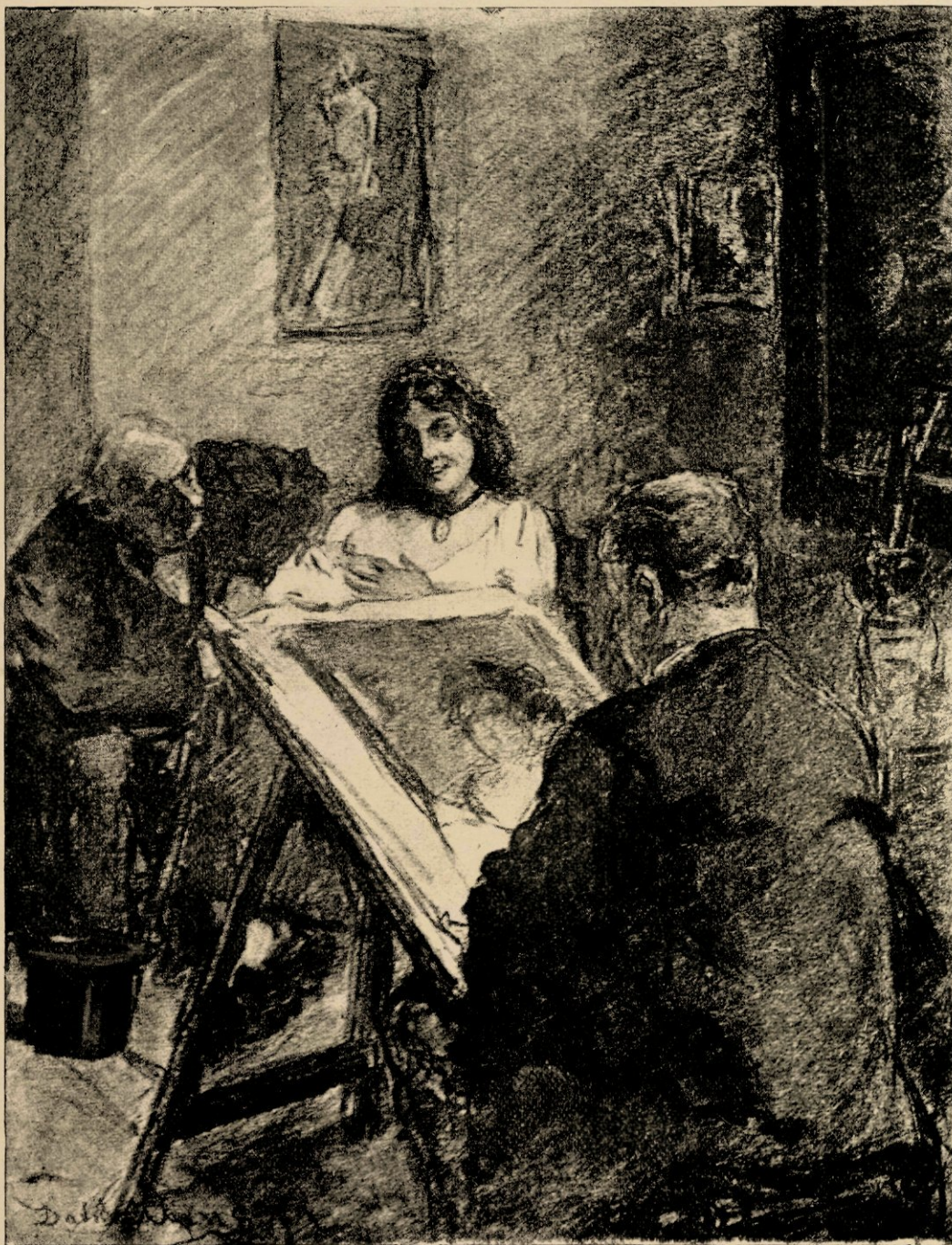
Bij 't model, houtskoolteekening van David Oijens.

derijen toe te schrijven; voornamelijk draagt tot dit resultaat bij hunne voortdurende studie der ongezochte, ongekunstelde en karakteristieke bewegingen, die elk der beide schilders in zijn alter ego opmerkt juist wanneer deze niet als model zit. Dergelijke typische instantané's , waar het kunstenaarssoog het