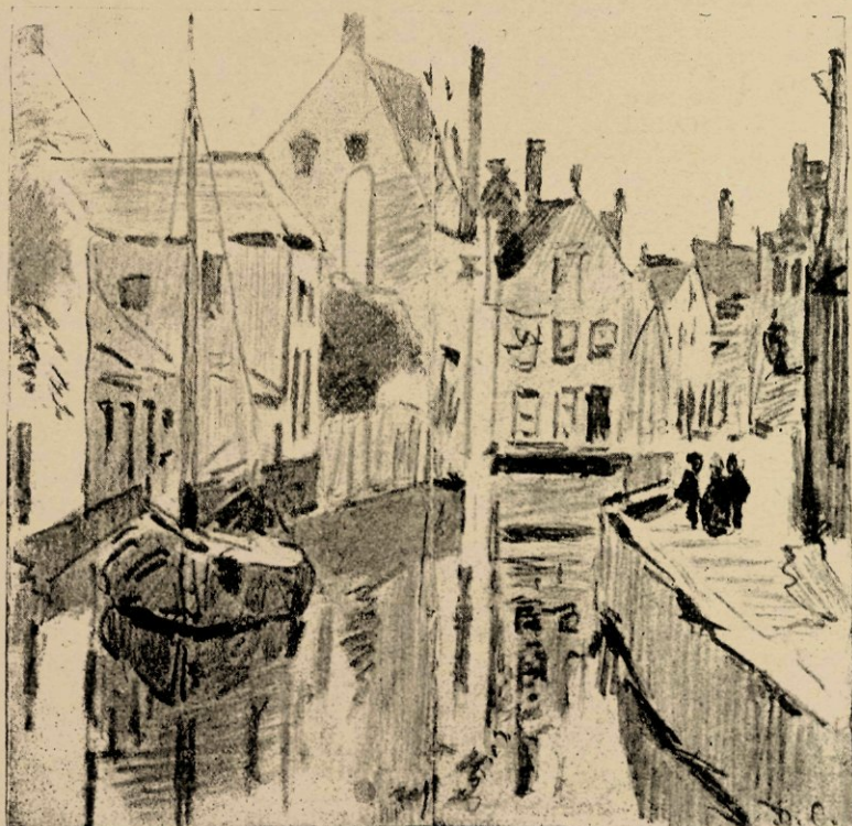
Brugge, potloodschets van David Oijens.

Geholpen door hunne moeder, die zij vroeger reeds half en half voor hun plan hadden ingenomen, gelukte het hun, na eindelooze en vurige pleidooien, den