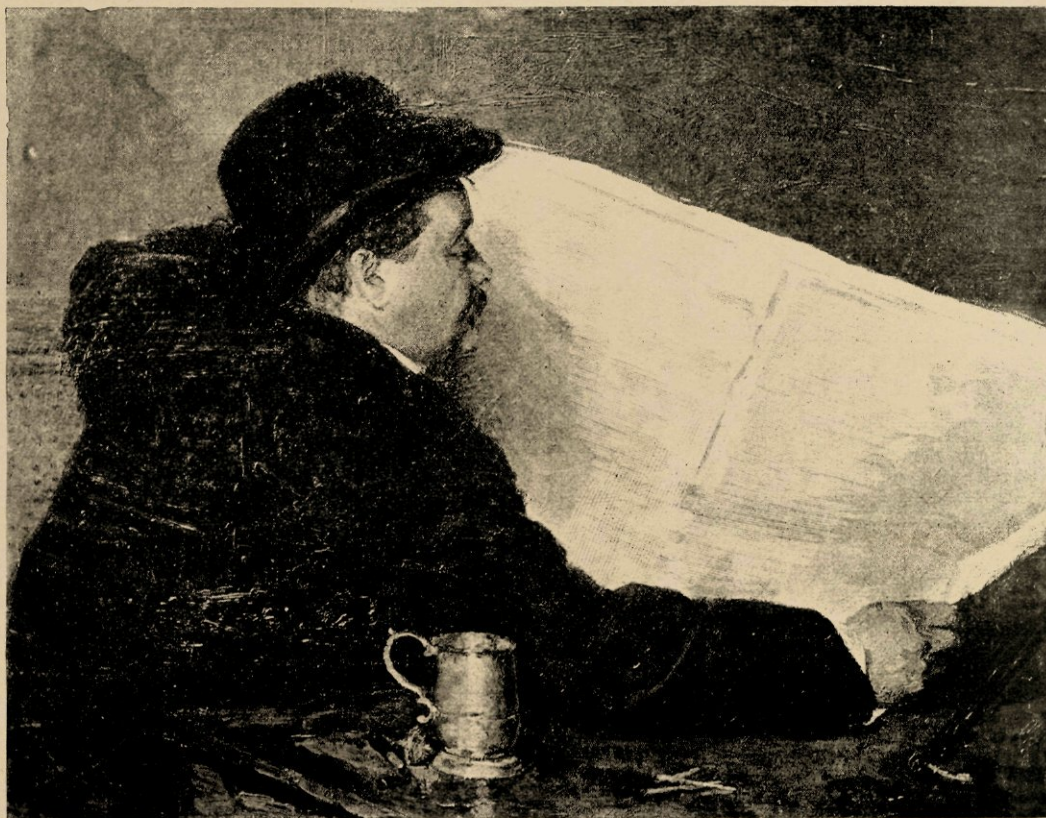
De krant, door Pieter Oijens.

Edoch, geheel en al zou de wensch van hunnen vader niet in vervulling gaan, want zoo de uitmuntende lucht hunne longen versterkte en hunnen