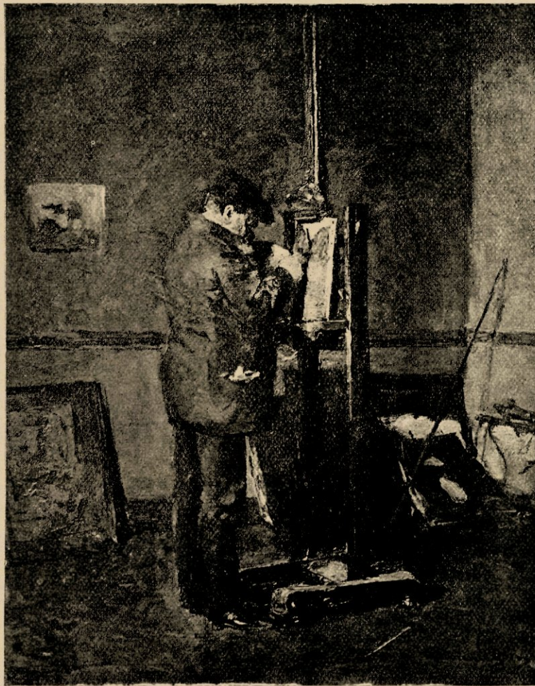
Aan het werk, door David Oijens.

En nu . . . . met den vriendelijken lezer te verwijzen naar de uitmuntende reproducties van schilderijen en teekeningen der beide broeders, vermeenen wij onze taak te kunnen besluiten: welsprekende tafereeltjes als de hierbij ingelaschte, waar zelfs de titels overbodig schijnen, vereischen voorwaar geen nadere toelichting.