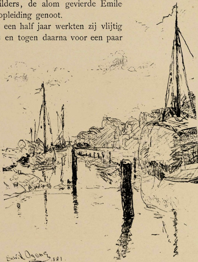
De Amstel, nabij de Amstelveensche weg, krijtteekening.

ietwat vreemd accent, zijn blond haar, zijne doodkalmte bedardheid — van de wilde rumoerigheid van eertijds was geen greintje meer in hem gebleven — werd Pieter, niettegenstaande zijne plechtige, ja, verontwaardigde verzekeringen, algemeen voor een Duitscher gehouden. Het uitbreken van den oorlog maakte zijn verblijf in het koortsachtig opgewonden Parijs alles behalve aangenaam; de zoogenaamde „ Prussien ” oordeelde het dan ook raadzaam ijlings zijn bundeltje te snoeren en ademde weer ruimer toen hij de Fransche grenzen achter den rug had. Eenigen tijd nog verbleef hij te Amsterdam, doch voelde weldra den machtigen drang, terug te keeren tot zijn broederlijken alter ego , met wien hij vroeger steeds gewerkt had, en sedert dien ook samenbleef.