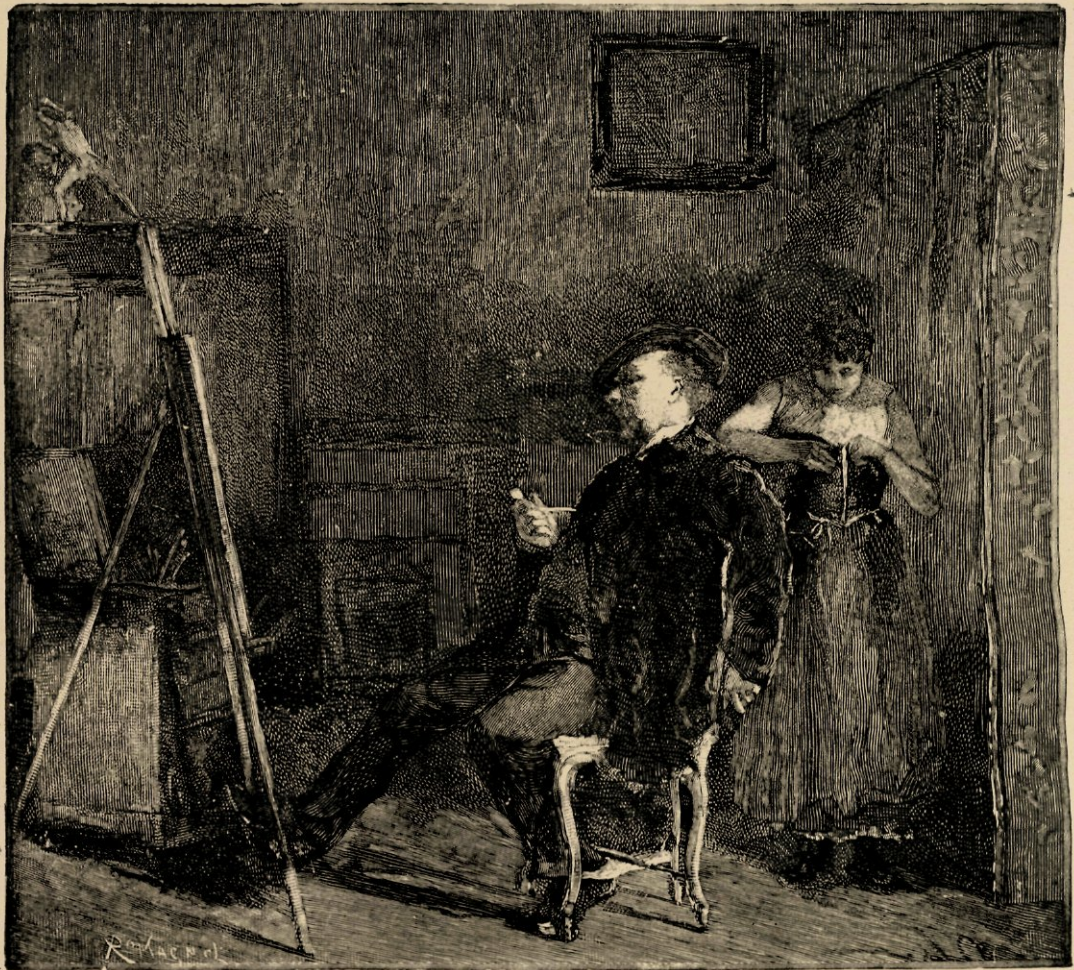
Na de zitting, naar eene aquarel van David Oijens.

Nu zou ik een heel eind bezijden de waarheid blijven, indien ik hier vertelde dat het tweespannetje, ettelijke jaren later naar school gezonden, dol veel van studie hield; rijkelijk begaafd met een veelbelovenden aanleg voor