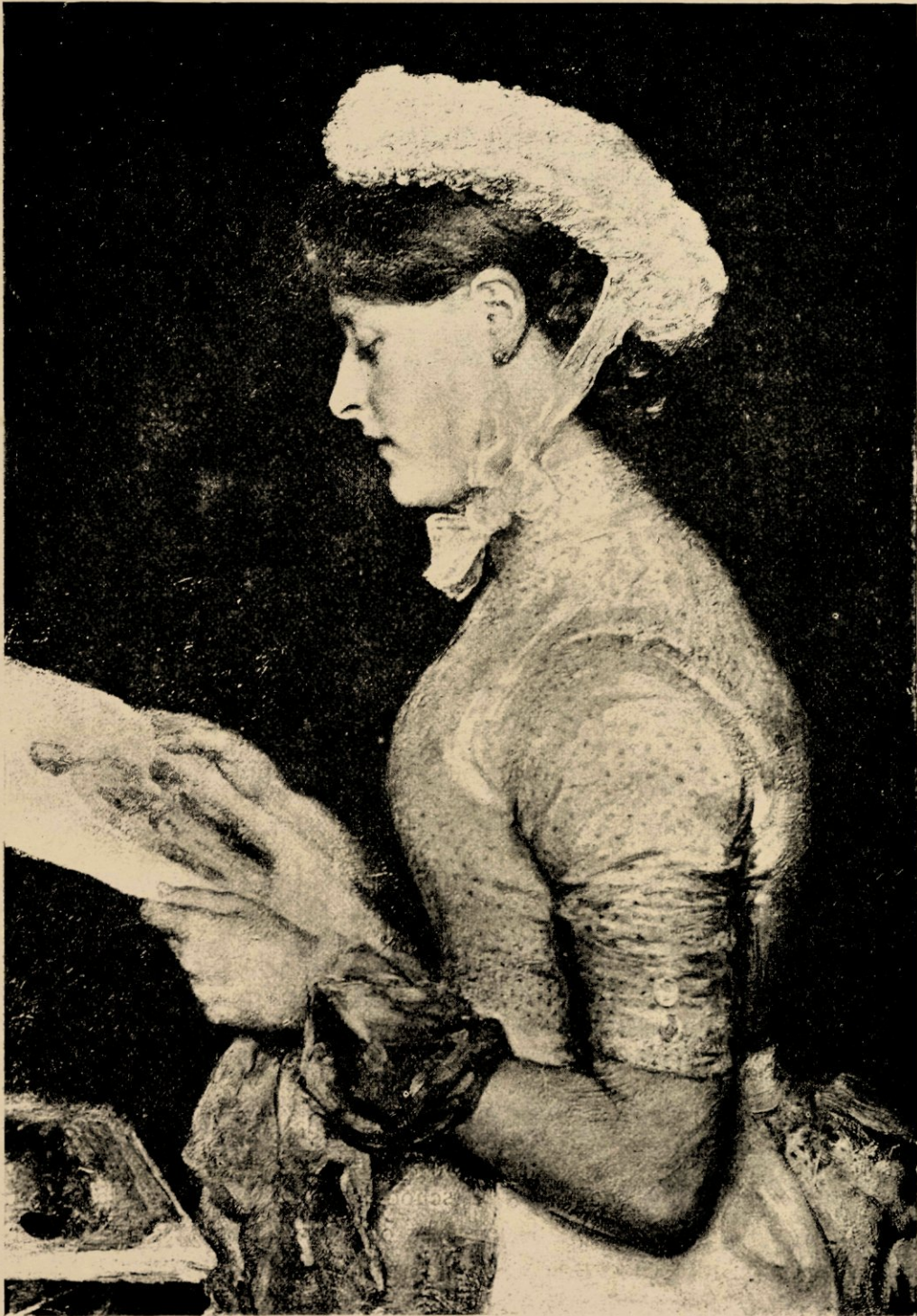
Amsterdamsch dienstmeisje, door Pieter Oijens.

zoals het dikwerf gaat, terwijl de met veel kunstgevoel begaafde moeder welgevallig de meesterstukken harer jongens gadesloeg, zag de op hun stof-