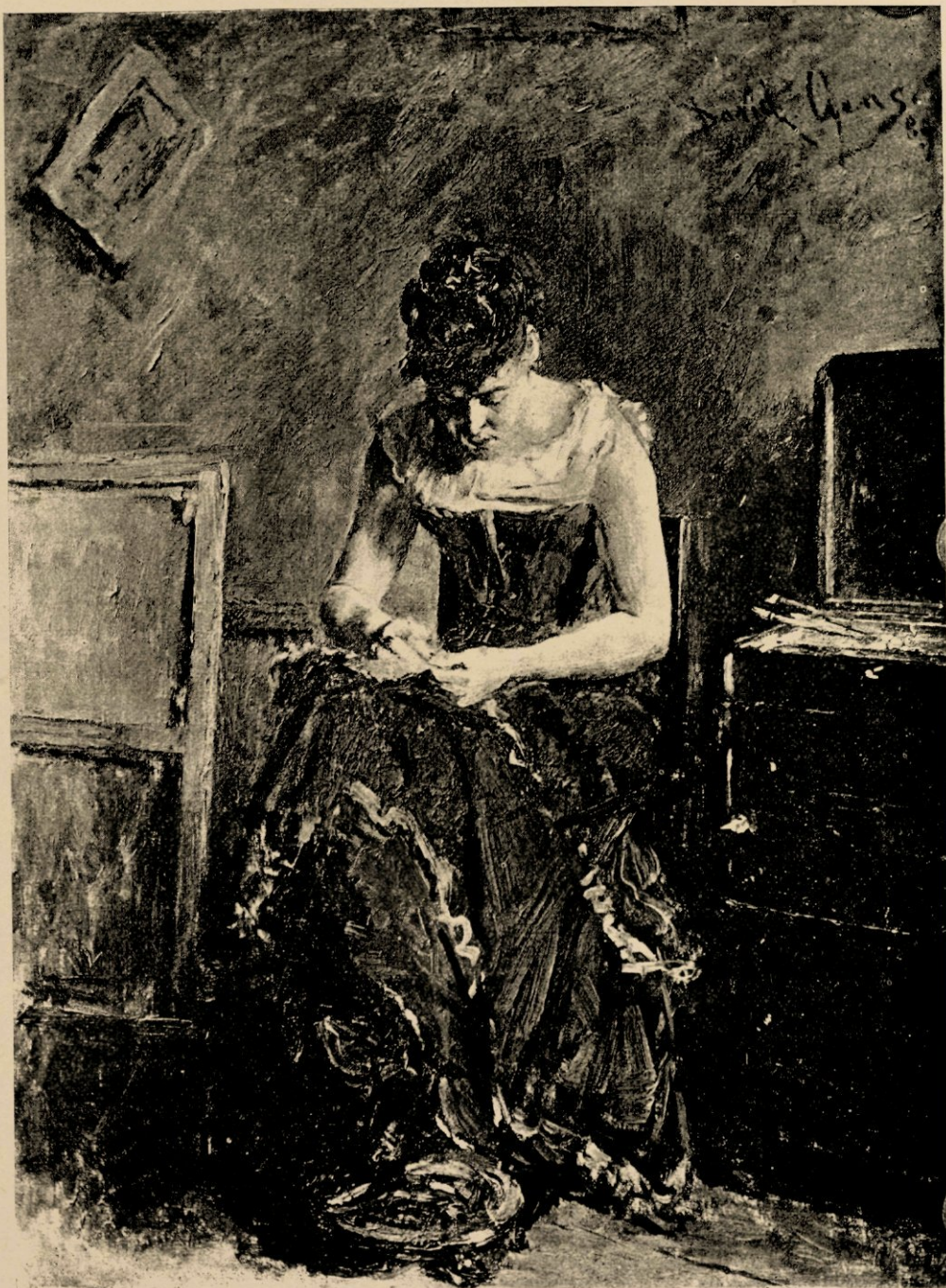
Vóór de pose, door David Oijens.

Op geene der tentoonstellingen, waaraan zij tot dusverre hadden deelge-