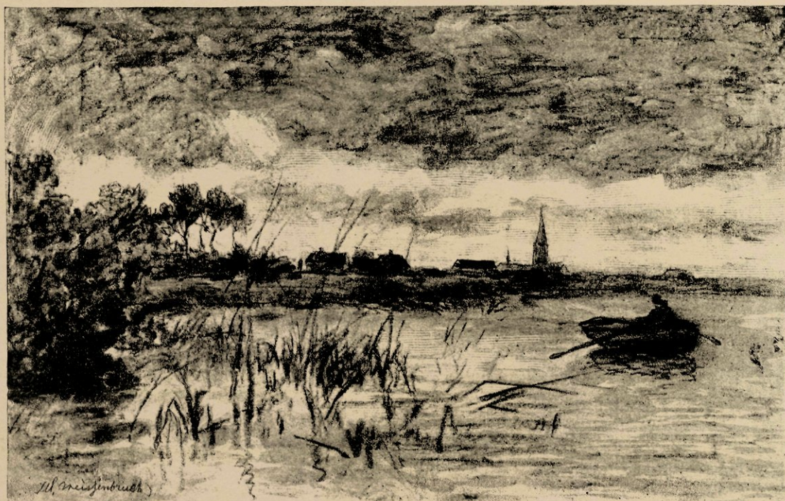
Plas bij Noorden, naar eene krijtstudie.

Schelfhout bood hem n.l. een plaats als élève op zijn atelier aan (en dit aanbod was — met het oog op de toenmalige groote bekendheid van dien schilder — voor een jong artiest niet weinig eervol). Maar Weissenbruch, bevreesd daardoor te veel onder den invloed van den meester te zullen komen, verklaarde liever alleen te blijven werken, om dan van tijd tot tijd zijn arbeid aan het oordeel van Schelfhout te onderwerpen. In het begin nam de meester het den élève kwalijk en kon zich niet begrijpen, dat iemand het