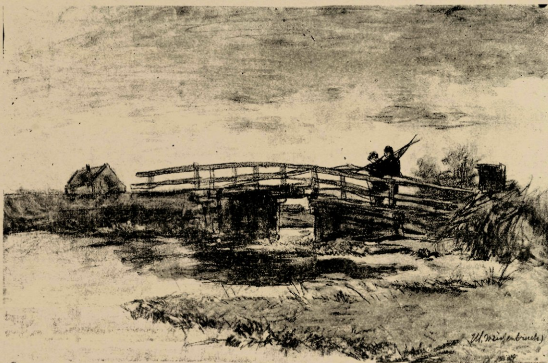
Brug bij Noorden, naar eene studie.

Kom bij hem op 't atelier, en ge vindt er hem (met de onmisbare pijp in den mond) omringd door een menigte teekeningen; de meeste liggen op