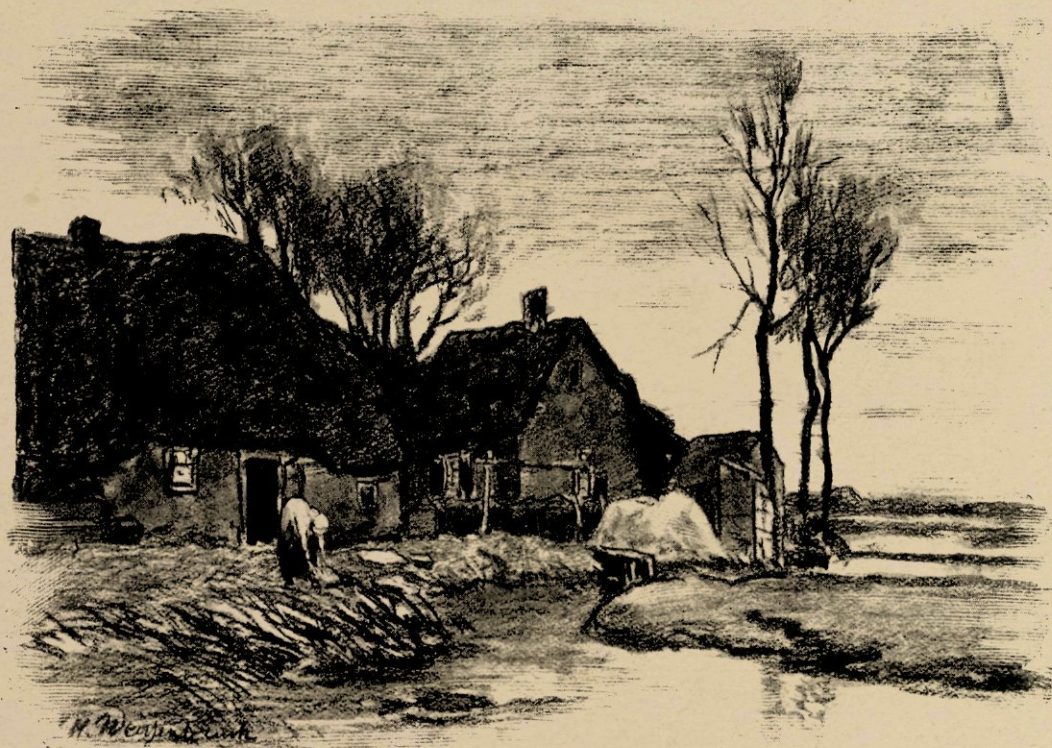
Boerderij te Noorden, naar eene houtskoolteekening.