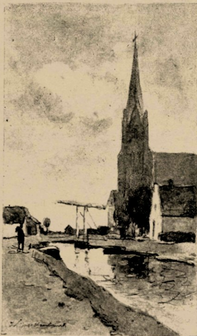
Noorden, naar eene teekening in O. I. inkt.

zele jongen uit het dorp. Voor hem is het jaarlijksche bezoek van den schilder een bron van genot. Reeds eenige dagen vóór zijne komst staat de knaap, op den weg naar Nieuwkoop, naar ieder rijtuig uitziende, dat hem zijn vriend zou kunnen brengen.