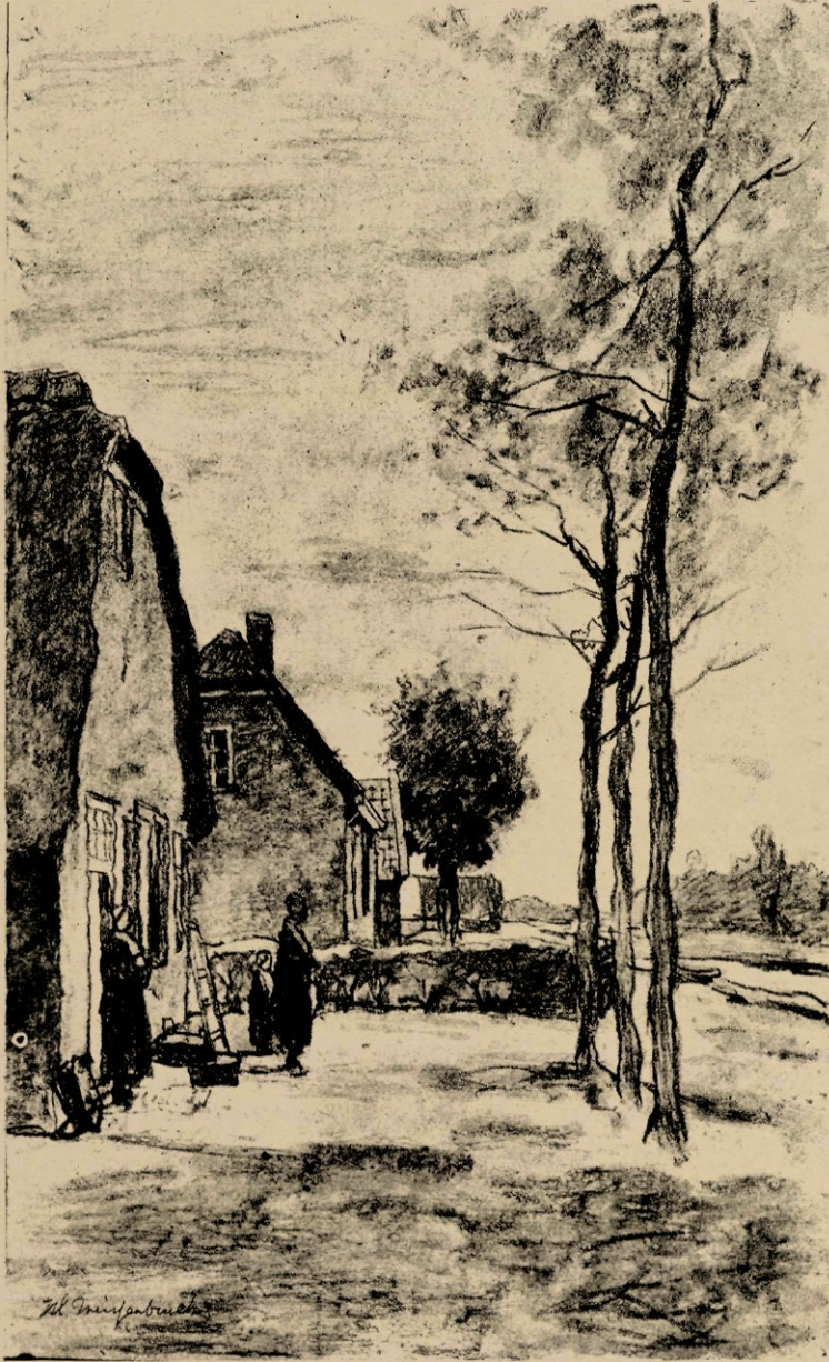
Noorden, naar eene krijtstudie.

„Vurig van geest” is hij als mensch en als kunstenaar; frisch en jeugdig, als toen hij pas begon. — Er heeft zich wel eens het vreemde verschijnsel voorgedaan, dat zwakke personen juist een zeer mannelijke, krachtige kunstuiting hadden, en omgekeerd flinke, robuste personen zeer zwakke kunst maakten. Maar dit verschijnsel is en blijft een zeldzaamheid, een uitzondering.