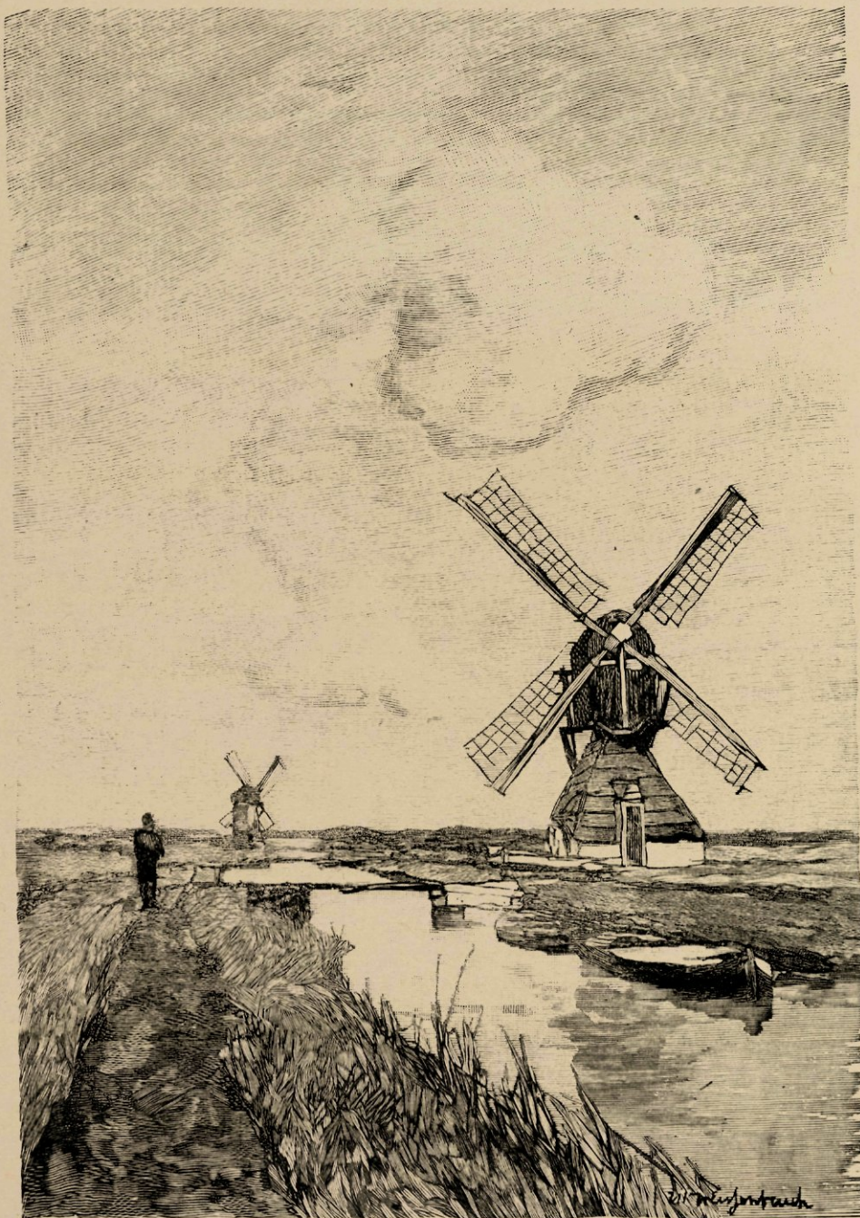
Bij Voorschoten, naar eene studie in O. I. inkt.

noodzakelijk gevolg is van zijn geheele temperament. 't Is of bij hem alles harmonisch is; het één is een logisch gevolg van het ander. In dien zin moet Weissenbruch zoo schilderen, als hij 't doet, kan hij niet anders. De natuur zelve wees hem zijne plaats aan tusschen zijn kunstbroeders.