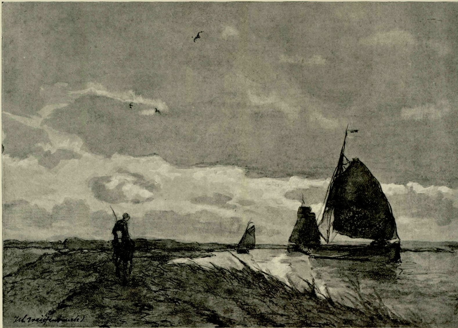
Het Spaarne, naar eene aquarel.