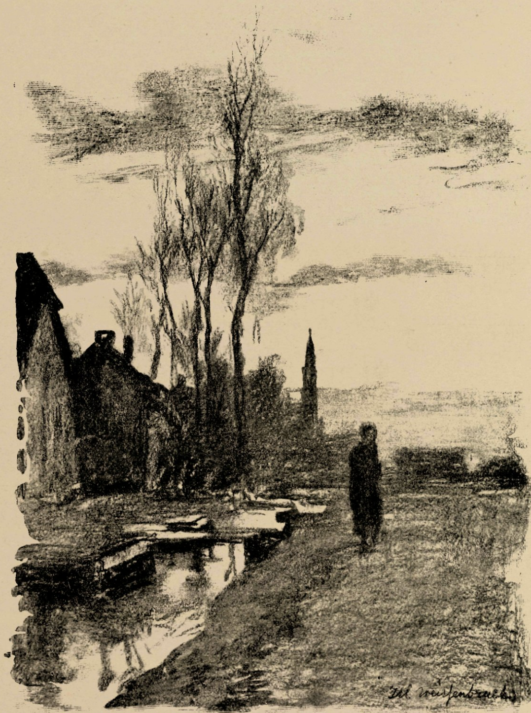
Avond te Noorden, naar eene houtschoolstudie.

Destrée eens zes weken studeerde, en waar zij, hard werkende, het al dien tijd uithielden voor dertig gulden!