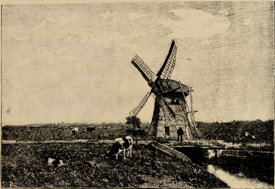
Molen onder Schiedam, naar eene schilderij in het museum Boymans.