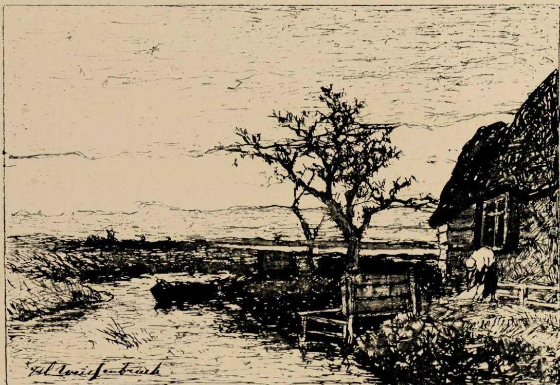
Aan de sloot, naar eene penteekening.

Toch — hoezeer Weissenbruch zich door de heerlijke lichteffecten laat meeslepen — trekt ook een ander moment in de natuur hem aan. Het is