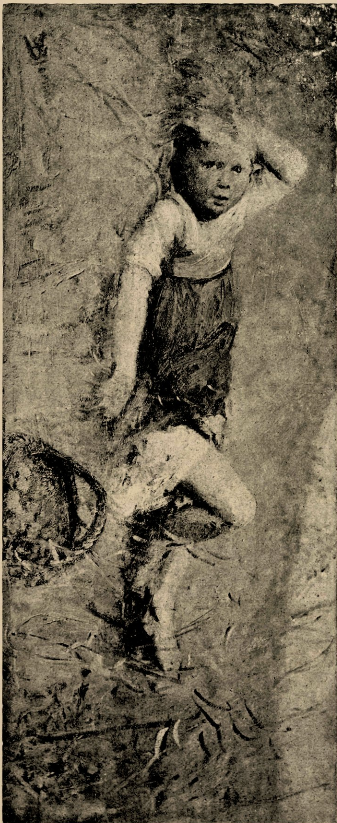
Bramstoker, reproductie naar de schilderij. Eigendom van Mevr. Blommers.

Wat was het ook nu mooi aan dien ouden Scheveningschen weg en wat zijn wij Amsterdammers in dit opzicht toch misdeeld, een beetje door de natuur, maar het meest wel door gebrek aan overleg en gevoel bij de voortdurende uitbreiding onzer stad. Wat was er niet te maken geweest van de Amsteloevers, van den IJ-kant, van de oude Singels, van het oude