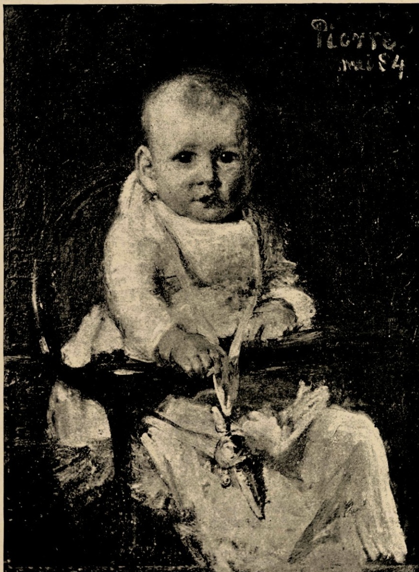
Pierre, reproductie naar de schilderij.

Het atelier van Blommers, boven, aan de achterzijde van het huis, gaat over de geheele breedte. Aan onze kleinere Amsterdamsche verhoudingen gewoon trof het mij altijd als immens, een waar schilders-Eden. En het is groot