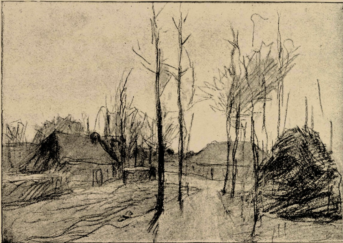
Dorpsgezicht in N.-Brabant, reproductie naar eene krijttekening.

Een van Blommers' beste stukken is het bekende: „waar zijn de duifjes?"; een schilderachtig Scheveningsch binnenhuis, vol toon en lijnen; de vloer belegd op allerlei wijze met matten en tegels; aan de bruin houten zoldering een teenen vogelkooi, die een fijne gele kleur geeft in het bruine binnenhuis. In die kooi de duifjes en in het midden der schilderij het krachtig, kranig