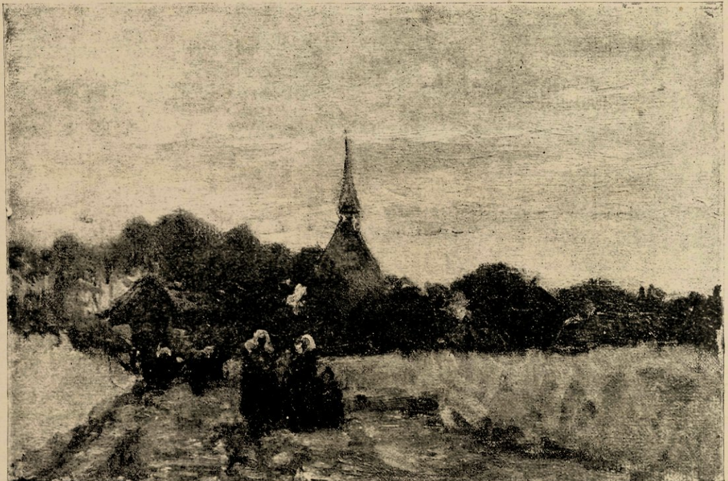
Kerkgangers in N.-Brabant, reproductie naar eene studie in olieverf.

Maar het is eene wanhopige taak van zulke werken een goed denkbeeld te