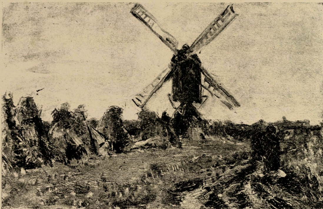
Molentje in N.-Brabant, reproductie naar eene studie in olieverf.

Uit de eerste verzameling van den Heer Post werd de Heer van Eeghen