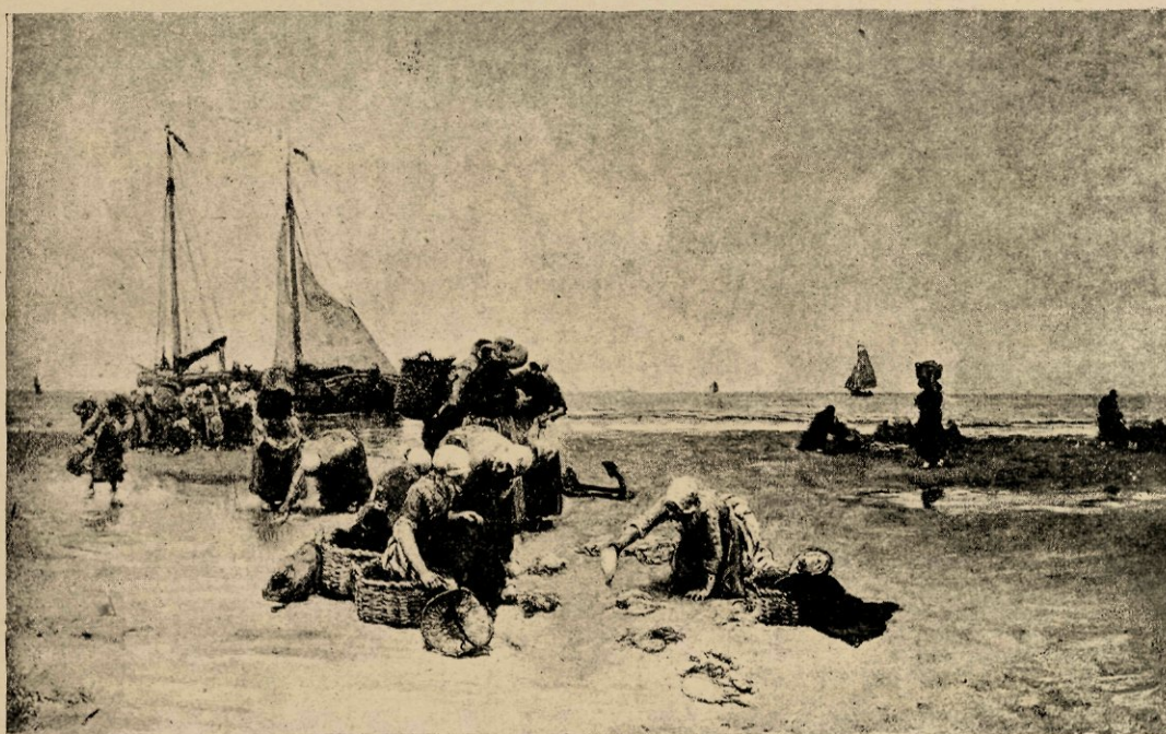
Aan 't strand te Scheveningen, reproductie naar de schilderij, uit een particulier kabinet.

Zijn stuk, wat onmiddellijk zeer de aandacht trok, hing toevallig naast een der groote stukken van Israëls en dit mede was aanleiding tot de kennismaking der beide schilders. De eigenlijke, persoonlijke, kennismaking had plaats op het Scheveningsche strand, toen Israëls, zittend in een strandstoel, op zijne eigenaardige, levendige manier, opmerkingen maakte over het