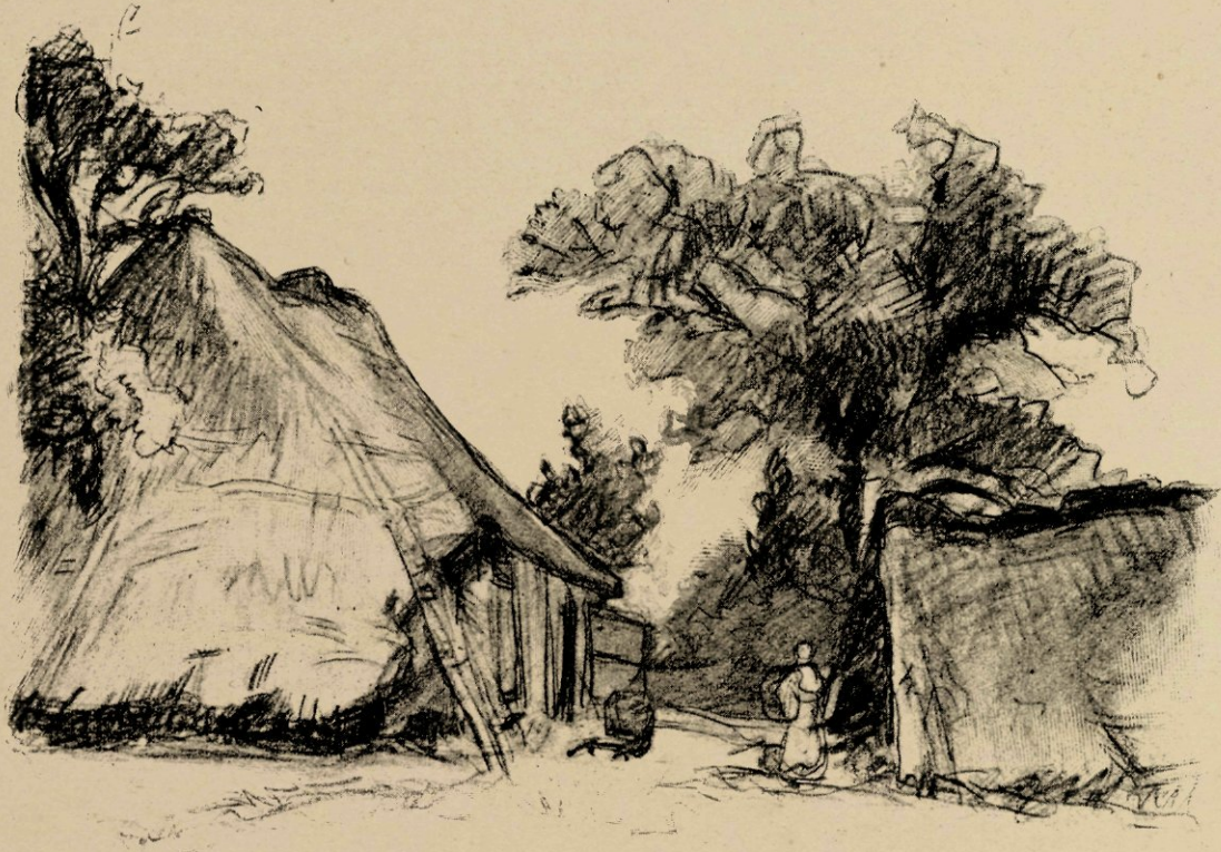
Dorpsgezicht in Gelderland, reproductie naar eene krijtteekening.

Kunstcritici en officieele beoordeelaars hier schijnen voor niets meer be-