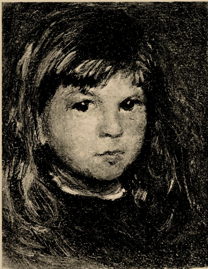
Willem, reproductie naar de schilderij.

Vershil van temperament en van opvatting! Uit den aard van zijn bedrijf