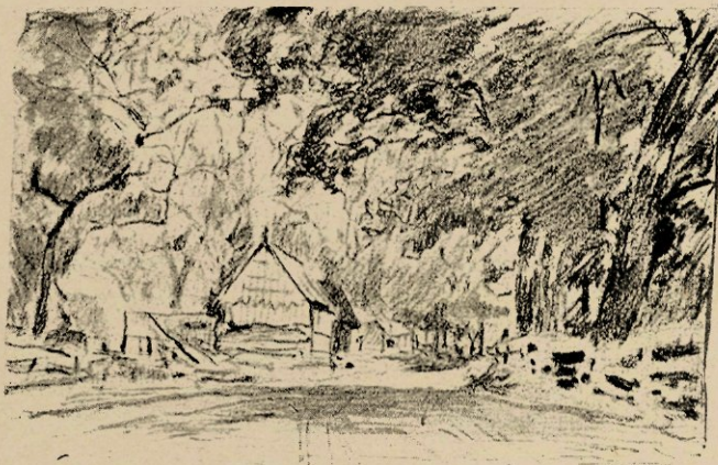
Bij Aalden in Drente, krijtschets.

ook eene der hoofddeugden van Bakhuyzen. Moge hij dan al niet de evenknie zijn van die groote meesters, zijne stukken bewijzen, dat er in de natuur plaats is voor een ieder, die zich ootmoedig aan hare borst nederlegt. Het genie breekt voor de menschheid nieuwe banen, — het talent voert haar langs bekende wegen tot het schoone en het ware. Bakhuyzen is een talentvol schilder.