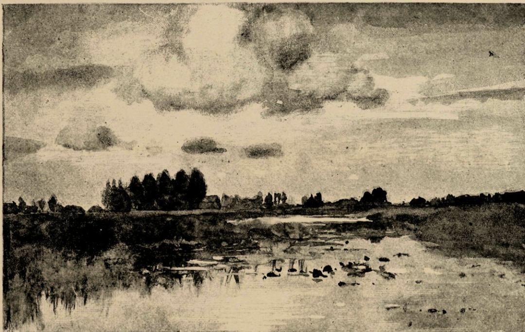
Plas bij Noorden, naar eene aquarel.

Van zijne eerste opleiding is weinig te vermelden. Zeer vroeg is hij niet begonnen, en het woord van Hooft: „gemeenlijk brengt de kintsheid maare van den man, die er in steekt,” is op hem niet toepasselijk; maar wanneer hij betrekkelijk lang gewacht heeft met het weergeven van zijne indrukken, toch werkten die indrukken al zeer vroeg in het gemoed van den aankomenden knaap, die uren lang in het Dekkersduin — een paradijs voor de