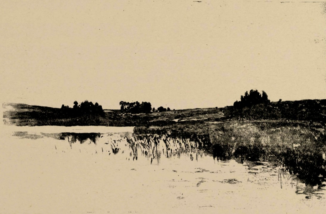
Plas bij Uelzen in Hannover, naar eene aquarel.

In het buitenland heeft hij weinig geschilderd: hij is er zelfs maar zelden geweest. In 1866 heeft hij een maand of acht in Dusseldorf doorgebracht, waar hij wel is waar partij trok van den omgang met de opgewekte kunstenaarsbent van de Malkasten, maar gelukkigerwijze zijne hollandsche eigenschappen niet aflegde. De weinige schilderijen, die hij daar voltooide, waren zonder uitzondering gezichten van Nederlandschen bodem, waaronder vooral een Geldersch landschap, dat op de tentoonstelling van den Haag in 1866 met de gouden medaille bekroond werd. Dat de jeugdige hollandsche schilder bepaald de aandacht van de Duitsche meesters trok, blijkt uit de mededeeling, mij gedaan door een zijner kunstbroeders, die in denzelfden tijd met hem in Dusseldorf werkte, dat Oscar Achenbach aan zijne leerlingen den