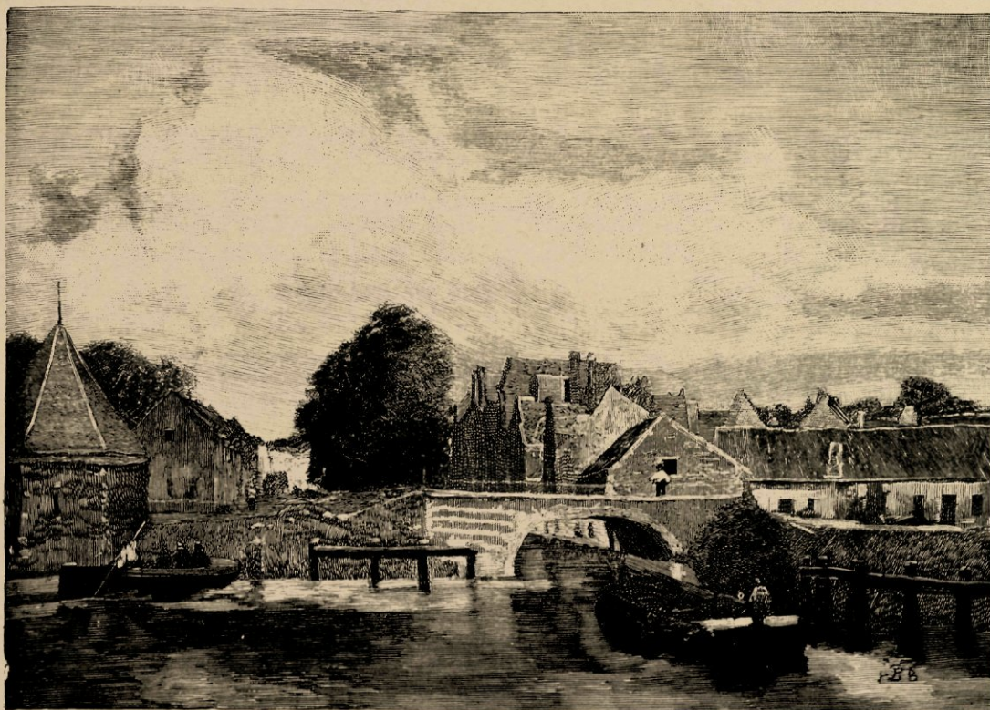
Stadsgezicht te Leiden, naar eene studie in olieverf.

Het is niet wel doenlijk, onze tegenwoordige landschapschilders met een enkel woord te karakteriseeren, omdat over het algemeen hun talent te veelzijdig is om ze elk in eene bijzondere rubriek te brengen, maar toch zijn er bij voorbeeld, die men meer bepaald de schilders zou kunnen noemen van de hollandsche plassen met haar eendenkroos en wuivende rietpluimen, of van de wilgen en slootkanten, tintelend van zonnelicht en morgendauw; weer anderen vermeien zich het liefst in de malsche weiden met grazend vee of in de zilveren berken, droomend verloren in de eenzame uitgestrektheid