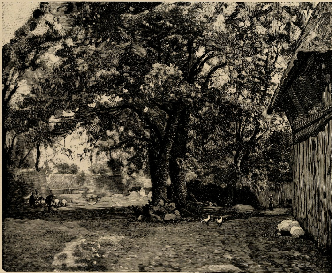
Eext in Drenthe, naar eene studie in olieverf.

het figuurteekenen verkreeg, die hem later bij het stoffeeren van zijne landschappen zulke groote diensten heeft bewezen. Want daarin, in het juist plaatsn van de stoffage, eene kunst, die zoo gemakkelijk schijnt en in werkelijkheid zooveel artistieken zin vereischt, is Bakhuyzen door weinigen geëvenaard, misschien alleen door Bosboom overtroffen: al zijne figuren, het mogen dan menschen zijn of dieren, kudden schapen of grazende runderen, ze maken met de hen omringende natuur één geheel uit; alles, vorm, kleur, toets, de plaats, die ze innemen, is met zeldzame juistheid berekend om het warme leven in te blazen aan de levenlooze natuur.