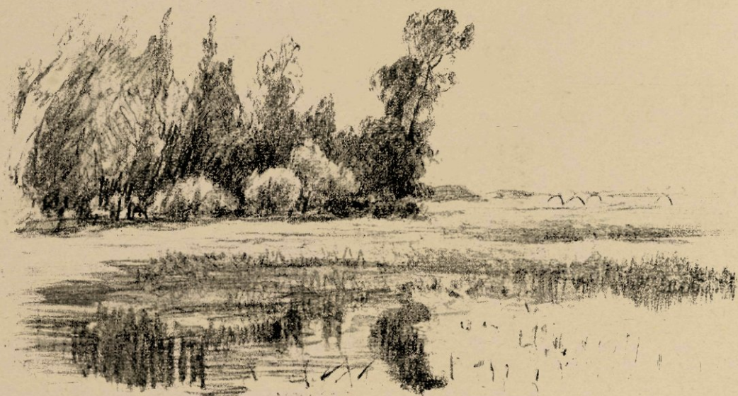
Aan de Maas bij Andel, naar eene krijtstudie.

Zulk een moeilijk oogenblik in het leven van Pulchri Studio was het, toen het in 1886 de aanzegging ontving, dat het lokaal van het Hofje van Nieuwkoop in het vervolg niet meer in huur kon worden verkregen. Aan de weemoedige gedachte, dat het genootschap die artistieke zaal, het tooneel van zooveel geniale ernst en zooveel geniale vroolijkheid zou moeten verlaten, paarde zich de bezorgde vraag, waar het nu voortaan zijne tenten zou moeten opslaan. Allerlei plannen werden opgeworpen, waarbij de dringende wensch naar een eigen gebouw de hoofdgedachte uitmaakte, en de commissie, die in