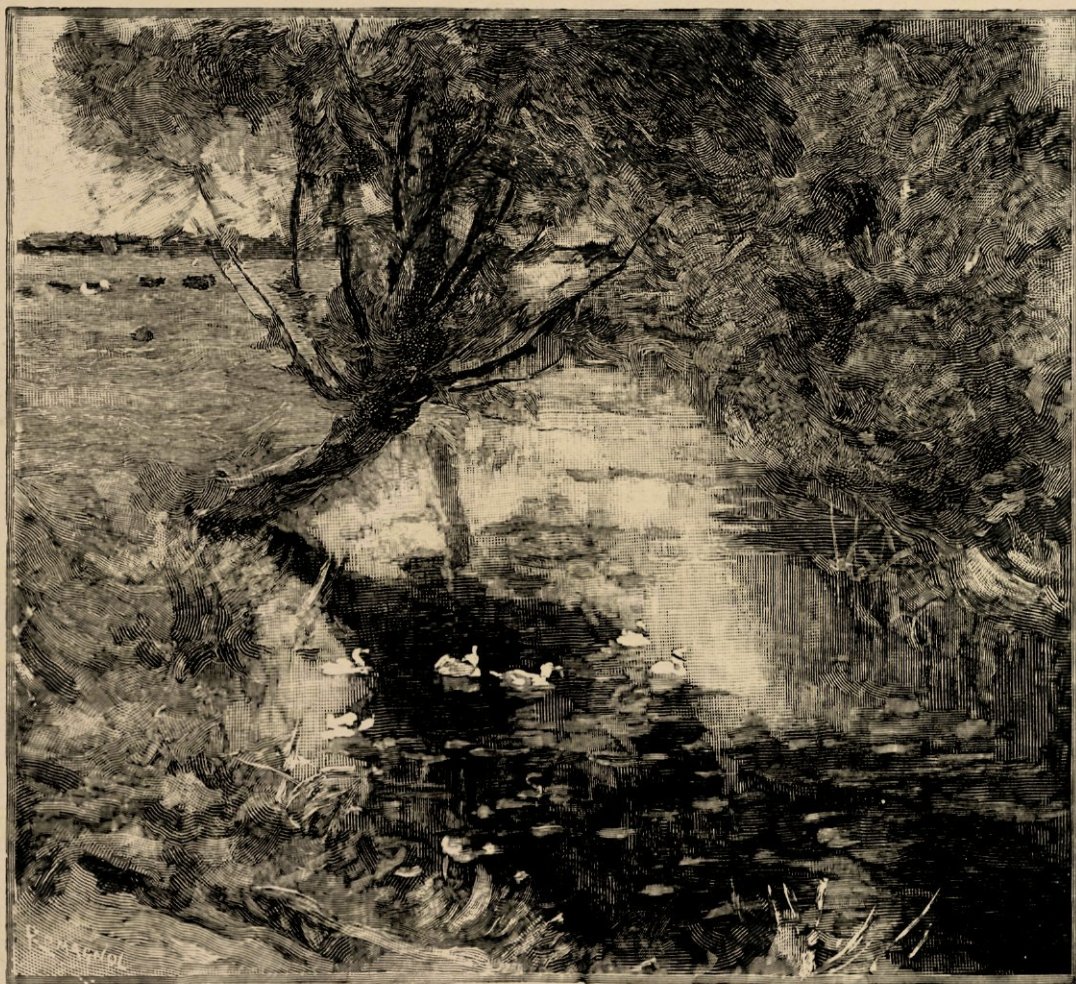
Slootje bij Wassenaar, naar eene studie in olieverf.

Neen, zijne kunst heeft de vastheid, de duidelijkheid, de eerlijkheid, zooals wij ze bewonderen in de werken van onze oude Hollandsche meesters, die zoowel naturalisten als impressionisten waren in den juisten artistieken zin van het woord; die de indrukken, waardoor ze bezielde werden, niet door eene vage kleurspeling trachtten weer te geven, maar door eene concrete voorstelling van de natuur, die zij hun levenlang hadden bespied en wier