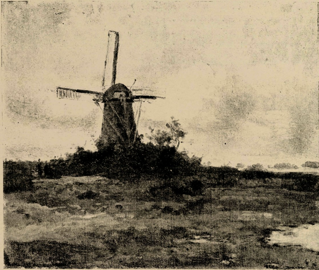
Molen bij Eext in Drente, naar eene studie in olievert.

blijkelyk genoeg zeyden: „en ik heb zien dat je olle kameraad ook weer meêkommen is, — een best man, hoor”. En te verwonderen is dat niet, als gij hem daar met zijne onverstoorbare kalmte ziet zitten, met zijn kort pijpje in den mond en de schilderkist op zijn knieën, omringd door een schaar oude en jonge bewonderaars, die in dat land nooit lastig zijn, maar elkaar fluisterend hunne bespiegeling meêdeelen „hoe alles er zoo duudelyk op steet”. En dan het plezier van de jongens en de wichten (een Drentsch