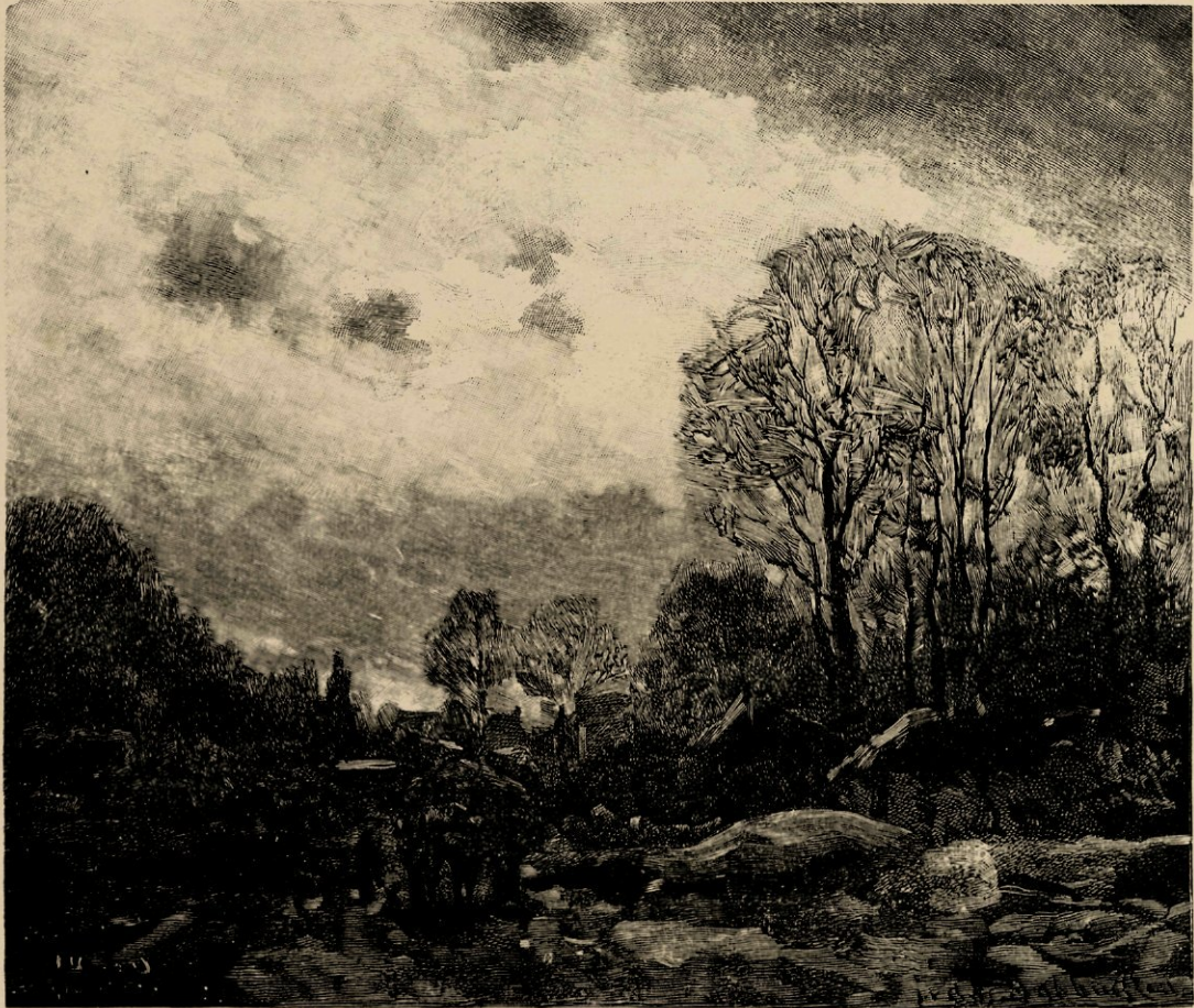
Schets voor de schilderij in het museum Boymans.

Overigens ligt het niet in mijn plan, van de vele stukken, die hij gedurende zijne welbestede kunstenaarsloopbaan voortgebracht heeft, eene opsomming te geven, die hier minder op hare plaats zou zijn. Vosmaer, naar wien ik hier mag verwijzen, heeft met kennelijke voorliefde vele van zijne schilderijen